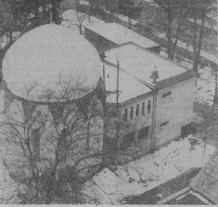
ciąg dalszy na str. 2