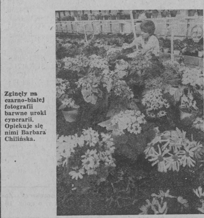
W tym sezonie jest szczególnie trudno, mała ilość i słaba jakość opadu zmusiła Zakład Usług Komunalnych do wyłączenia czterech z pozostałych 10 szklarni. W ogrzewanych przygotowywane są rozsady szalwii, żenizki i innych roślin przeznaczonych na klomby. Rosną również pelargonie, begonie, bulwiaste — to dla prywatnych odbiorców, goździki, kalie, astromerie — na kwiat cięty, oraz rozsada pomidorów. Jest również nieco roślin doniczkowych — cynerarii, tulipanów,

Choć w oleckich ulicach królują jeszcze zima, tamtejsi „miejscowi ogrodnicy” myślą już o wiosnie. Do końca marca chcą zamierzać zakończyć przecięcie drzew, aby wraz z ociepleniem rozpocząć wysa-