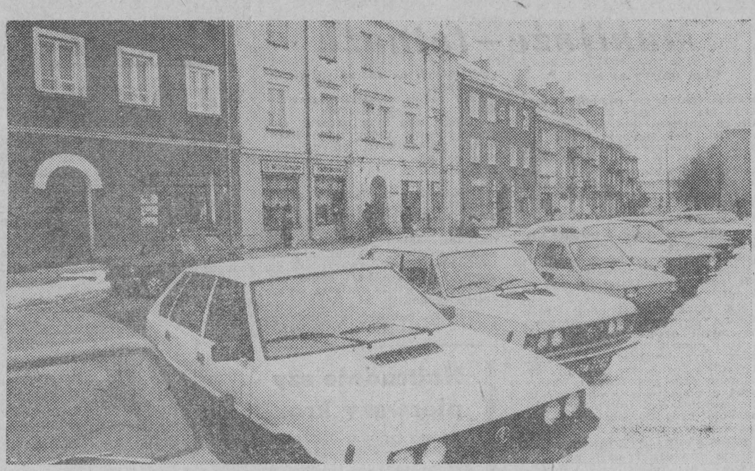
— Łomża zimą. Kłopoty parkingowe jak wszędzie...

W końcu ub.r. woj. suwalskie zamieszkiwało 459 tys. osób. W ciągu roku zawarto 3,4 tys. małżeństw. Zarejestrowano 9,1 tys. urodzeń. Przyszły naturalny przyrost wyniósł 5,3 tys. osób. W 315 szkołach podstawowych uczy się 68,7 tys. dzieci. Pod koniec roku w Suwalskiem pracowało 630 lekarzy i 166 stomatologów. (m)