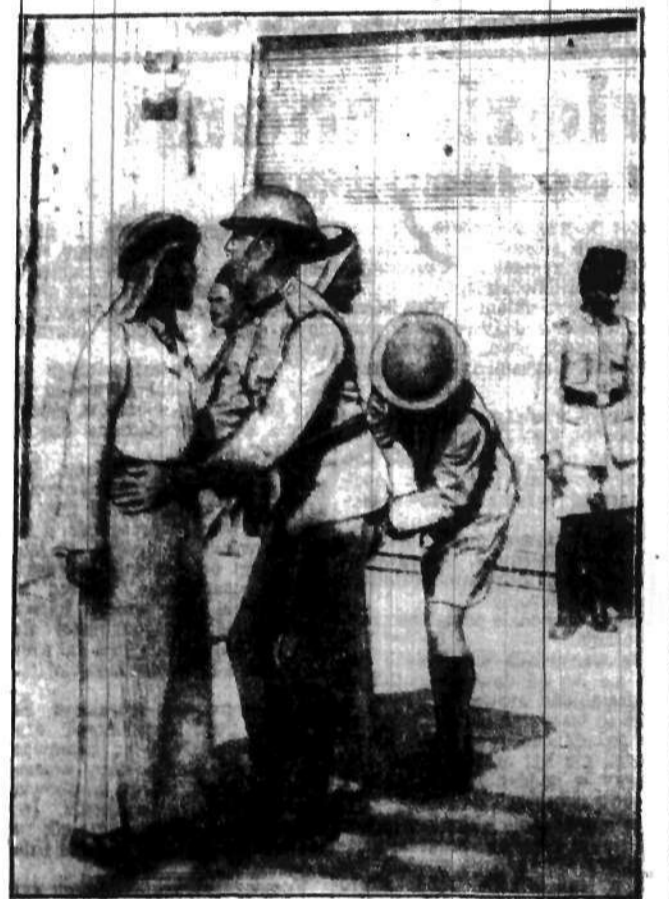
Patrol angielskich wojsk kolonialnych rewiduje na ulicach Jaffy przesko- dzą - arabów, w poszukiwaniu broń.