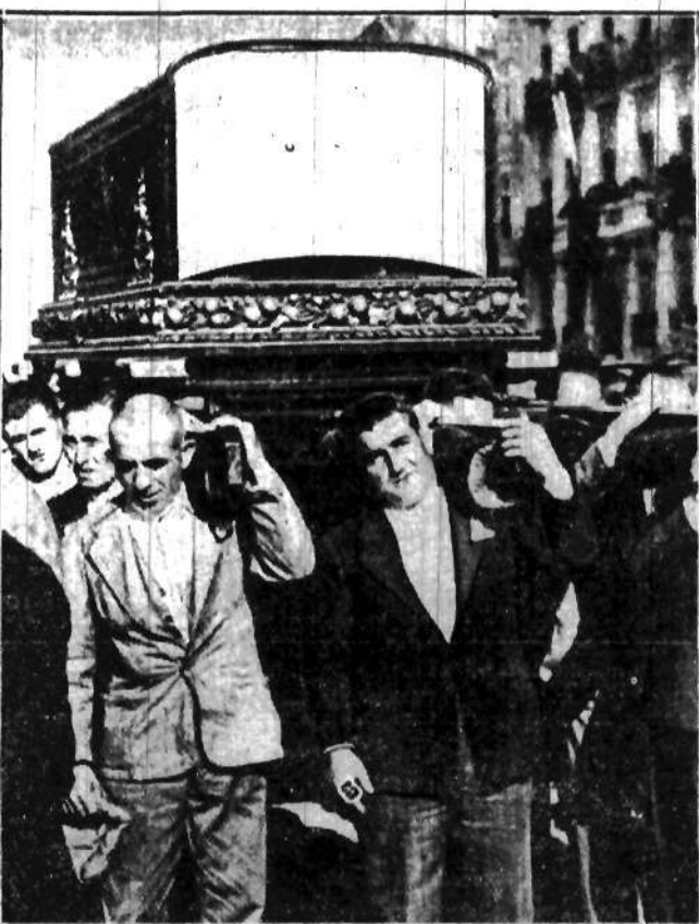
Sarkofag ze zwłokami znanego powłóciopisarza hiszpańskiego, twórcy „Czterech jeźdźców Apokalipsy”, Blasco Ibanez, podczas uroczystego pogrzebu w Walencji, dokąd przybyły drogą morską z Paryża. Blasco Ibanez był wielkim bojownikiem wolności i za walkę z monarchią wygnany został z Hiszpanii.