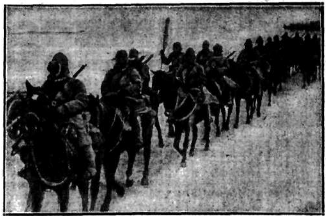
W okupowanej przez Japończyków Mandżurji pomimo ostrej zimy odbywała się utarczka z partyzantami chińskimi. Na zdjęciu kawalerja japońska w pościgu za bandami chunchuzów przebywa zamarzniętą rzekę.