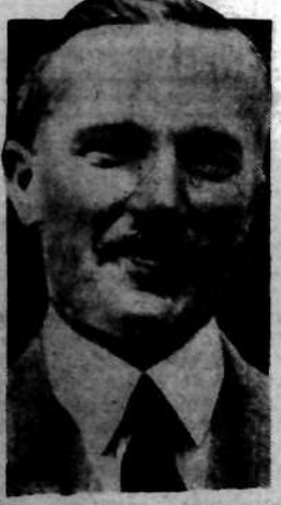
Aldrich nowoobраниy prezes najpotężniejszego na świecie domu bankowego — Chase National Bank w Nowym-Jorku.

Demokratyczna „Neue Leipziger Zeitung” pisze, że drużyny robotnicze Polski i Niemiec dały 20.000 widzów prawdziwą lekcję pogładowa wzorowego zachowania się.