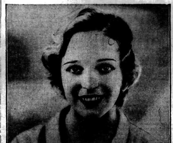
Uśmiech i ośniewający błysk białych zębów, to największa ozdoba kobiecej twarzy