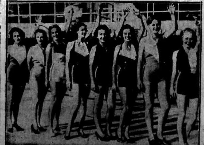
Ameryka wprowadza nowe kostiumy kąpielowe — z gumy, które przeciwdziałają dostępowi zimna do ciała kąpielących się nawet w chłodne dni zimowe