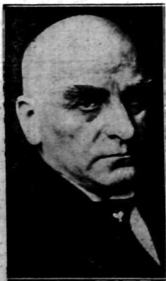
Prezydent pruskiej Rady ministrów Otto Braun, usunięty z zajmowanego stanowiska.