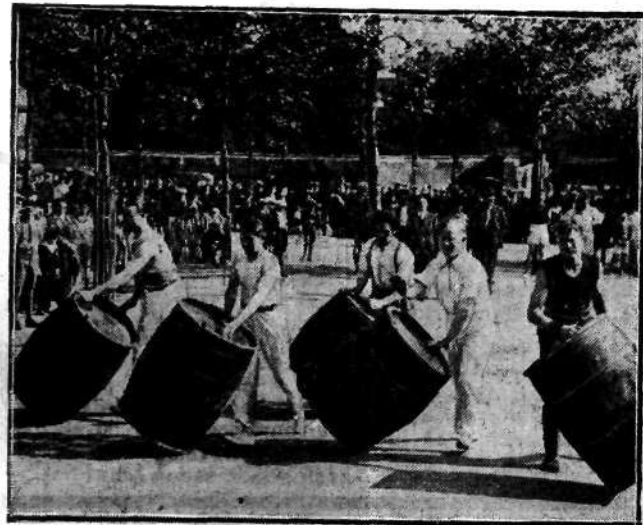
Niedawno w Montrealu pod Paryżem odbyły się ciekawe wścigi w prześciganu beczek. Na zdjęciu zawodnicy przy pracy.