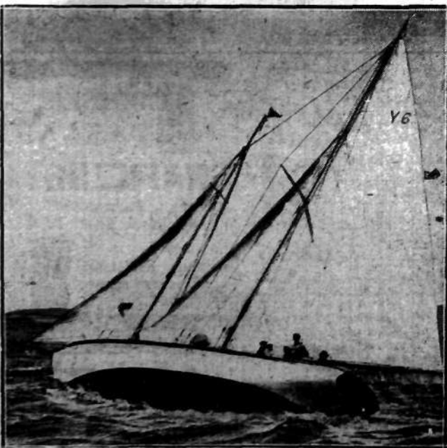
Jedna z żaglówek w chwili pokonywania wirażu na regatach żaglówek w pobliżu portu Sidney w Australii.