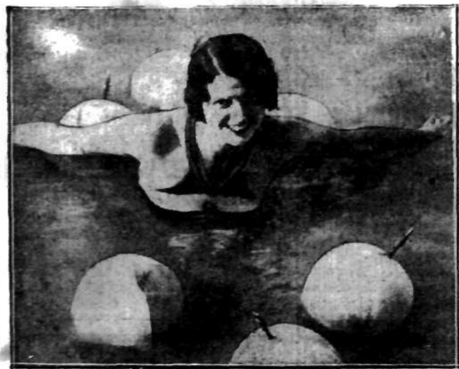
Przezorna kąpiel gwiazdy rewjowej w falach Atlantyku.