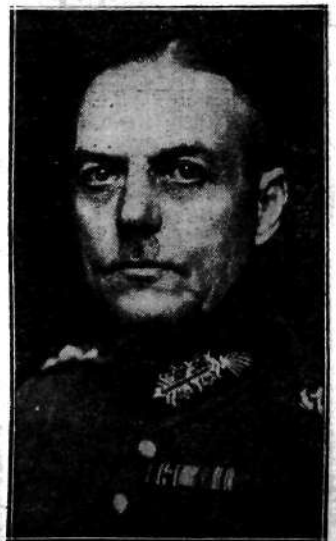
Mianowany naczelnym dowódcą wojskowym Berlina i prowincji brandenburskiej na czas stanu wyjątkowego.