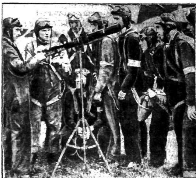
Sluchacze angielskiego uniwersytetu Cambridge podczas kursu pilotażu przysluchują się wykładowi teoretycznemu