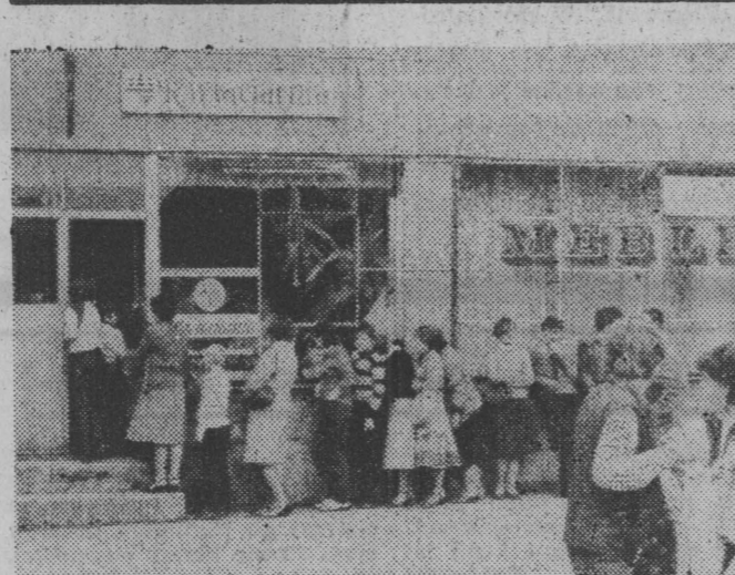
Mimo dość wysokich cen kwiatusów — blisko o połowę wyższych niż w Warszawie — łomżyńskie kwiatownice na brak klientów nie narzekają.

Znamienny to fakt, że od pewnego czasu rolnicy gminy GRAJEWO zwiększają hodowlę zwierząt. Potwierdza to m.in. wyniki spisu rolnego z czerwca br.