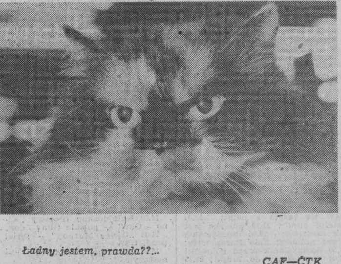
Ładny jestem, prawda??...