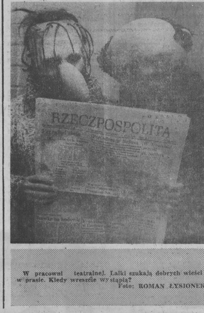
W pracowni teatralnej. Lalki szukają dobrych wieści w prasie. Kiedy wreszcie wystąpią?