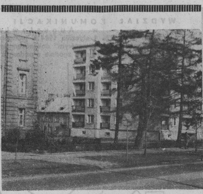
Postówka z Łomży.

Na nasze krytyczne sygnały zareagowało wreszcie Przedsiębiorstwo „Skupu Stawowców Włóczyńskich w Grajewie” i zainteresowało się swoją nieczytelną, skomplikowaną tablicą informacyjną, która „ozdabia” ul. Towarową, tuż przy moście kolejowym. Tablica została usunięta i przeznaczona na złom. Dotychczas jednak nie umieszczono nowej. Tymczasem nie wszyscy mieszkańcy wiedzą gdzie są przyjmowane surowce wtórne i tego rodzaju informacja jest stale potrzebna, nawet w interesie przedsiębiorstwa. (mar)