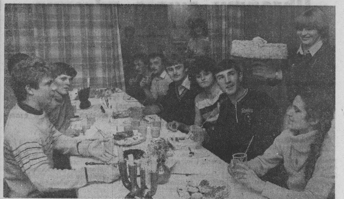
Wszystko jest smaczne i dziewczęta z Zespołu Szkół Zawodowych nr 1 zbierają pochwały kolegów z Zespołu Szkół Zawodowych CZSP.