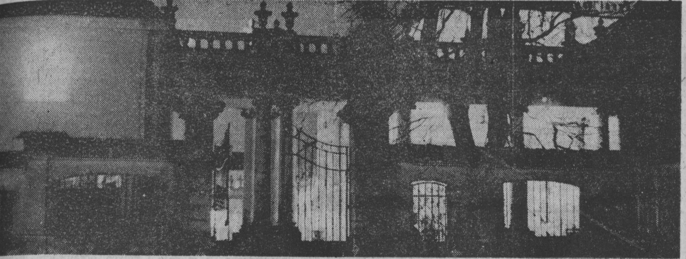
Architektura i światło