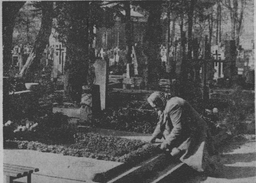
Historia dwóch wieków — kamień, żelazo, beton...