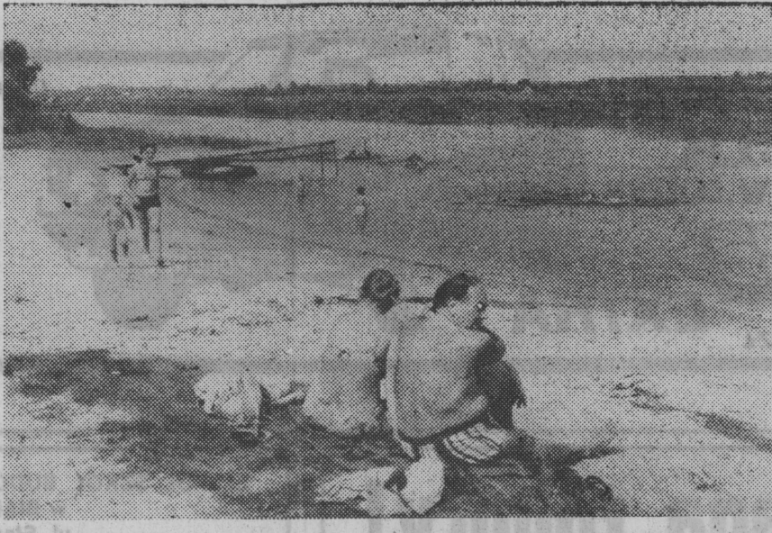
Są jeszcze nad Biebrzę piękną i mało uczęszczaną przez turystów miejsc.

przez Siedliska, która kursują miejskie autobusy. Ruch na tej trasie wcale nie jest mały, co na pewno ma swój wpływ na stan przejeżdżających tamtędy pojazdów, a szczególnie autobusów. Należałoby jak najszybciej uporządkować drogę.