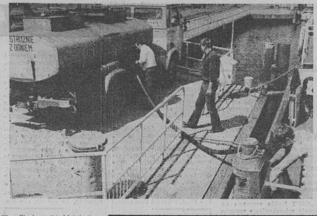
Choć statki białej floty pracownicy kursują, to jednak musi znaleźć się czas na tankowanie paliwa. NA ZDJĘCIU: „M. Nowożółco” w trakcie pobierania oleju napędowego. Jedna „dawka” to tysiąc litrów.

Jakby na problem nie patrzeć, jest on odzwierciedleniem ogólnej sytuacji w tym zakresie. Jemu również, a może właśnie jemu szczególnie, poświęcać należy największą uwagę.