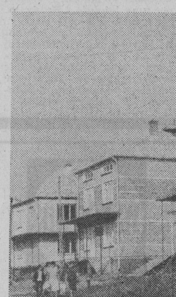
Osiedle domków jednorodzinnych w Goniądzu.

W materiałach przedłożonych radnym podczas niedawnej Sesji WRN stwierdzono m.in., że przeciętny obraz usług bytowych na terenie gminy wiejskiej to ok. 50 p.roc zakładów rzemieślniczych oraz 2-3 zakłady spółdzielcze WZSRS, GS i spółdzielnie pracy nie inwestują w usługi