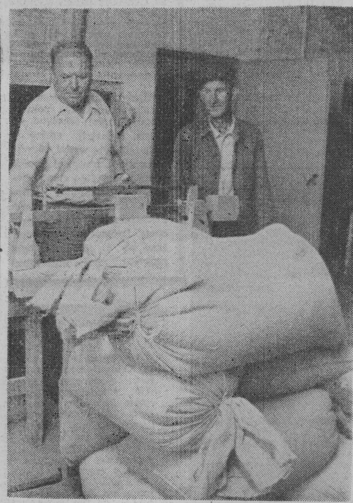
W punktach skupu na terenie całego kraju ruch, jakiego nie pamiętają najstarsi ich pracownicy. Takich dostaw zboża nie było nawet w najbardziej urodzajnych zniwach...

W lapidarnie charakterystyce nagrodzonego projektu odnotowano: „technologia u-