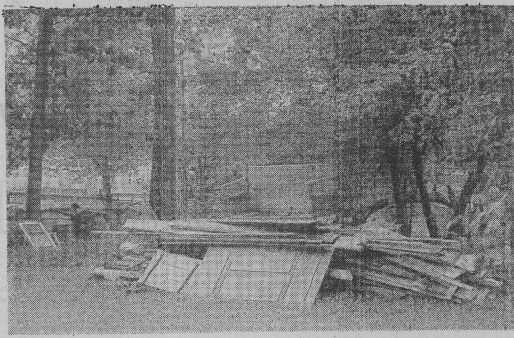
Obok spornego domu rośnie sos drewna z rozebranej chaty.

Poprzednio nasi konserwatorzy w Poczdamie — Sanssouci odnowili dawne stajnie królewskie, w których powstało pierwsze w NRD muzeum filmu. Obecnie nasi fachowcy przywracają dawną świetność nowym komatom, znajdującym się w okolicy wzniósłemu w 1747 roku. Początkowo służył on funkcje oranżerii, w latach 1771—1774 przebudowany został na dom dla gości dworskich. (PAP)