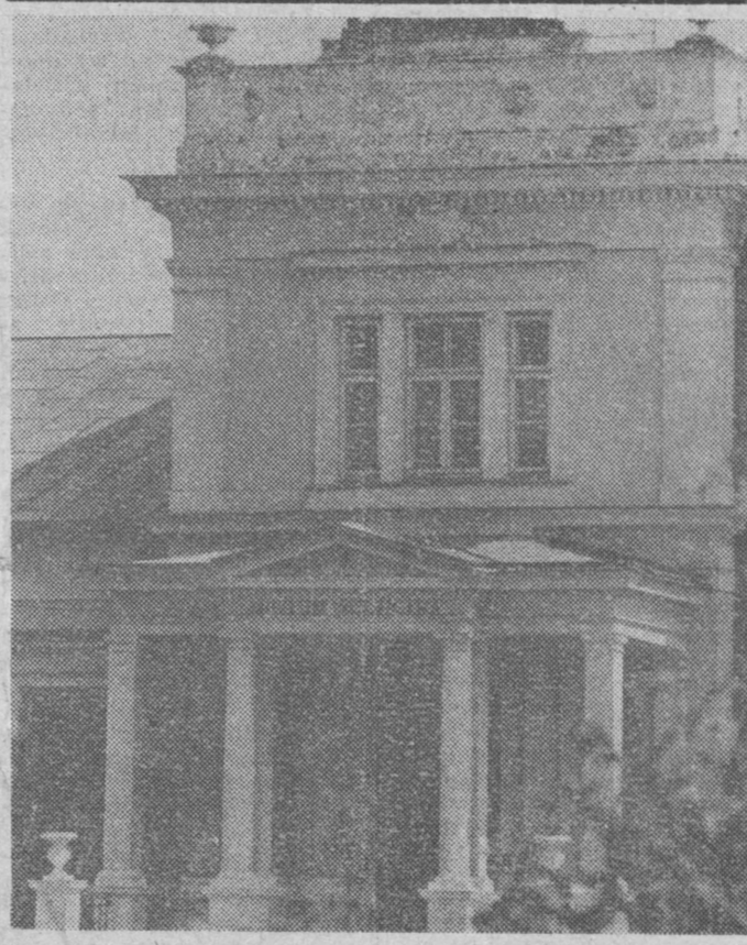
W tym roku Muzeum Rolnictwa im. Krzysztofa Kluka w Ciechanowcu obchodzi swoje 20-lecie...