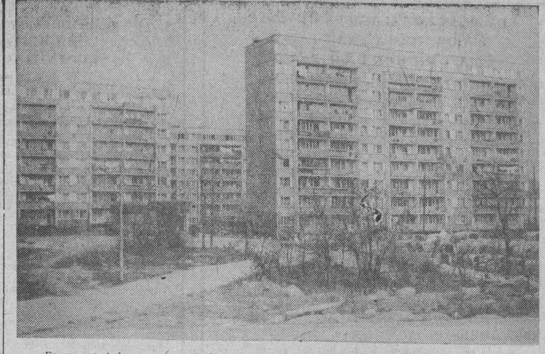
Fragment jednego z najmłodszych osiedli białostockich — Białostocki.

W związku z formowaniem się dnia 1 maja kolumn do pochodu, od godziny 9.45 do zakończenia manifestacji 1-majowej zamknięta będzie droga kołowa ulic Lipowa i Rynek Kościuski.