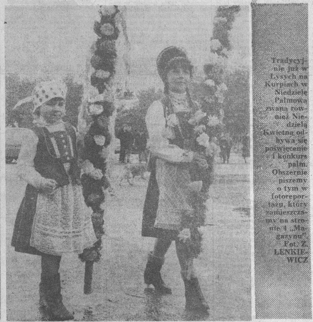
Tradycyjnie już w Łysych na Karpach w Nidzicy Palmowa zwana również Niedziela Świąteczna odhrywa się poświęceniem konkurencyjną palmę. Obszernie piszemy o tym w fotoreporażu, który zamieszczamy na stronie 4 „Magazynu”.