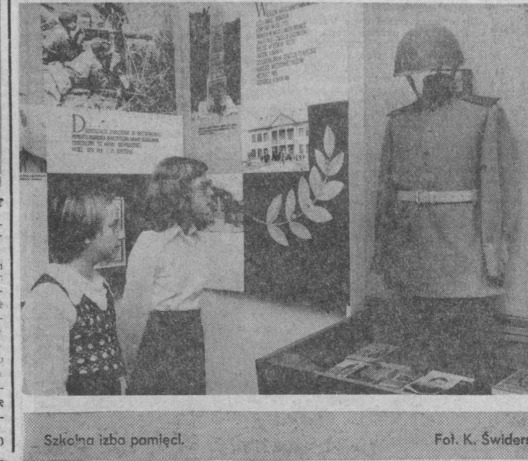
Szkolna izba pamięci.