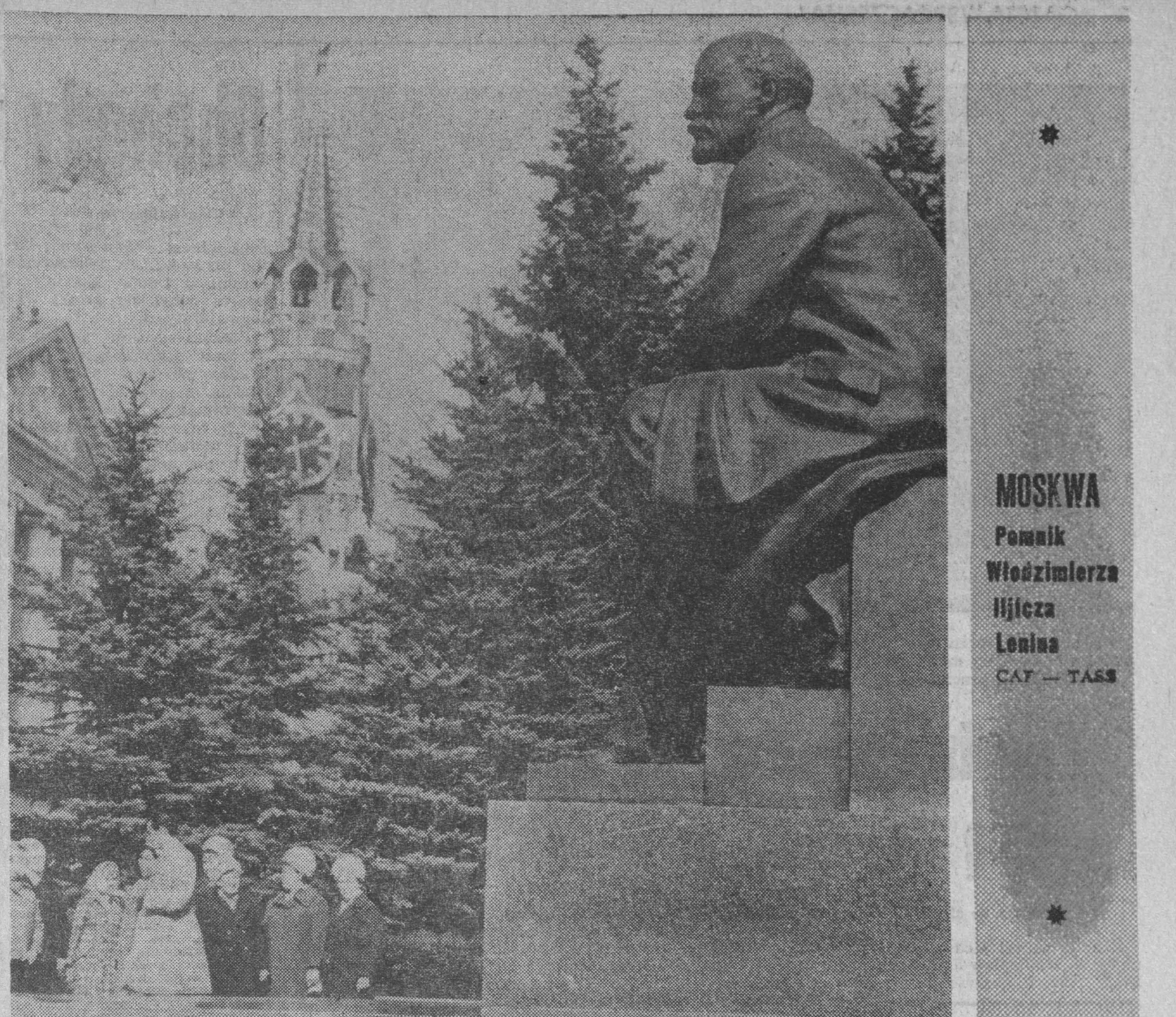
MOSKWA Pomnik Włodzimierza Iljicza Lenina