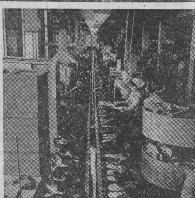
Taśma produkcyjna w zakładzie „Niemani”.

Zaczęła się wytrwała praca nad ustalaniem reperturu, szlifowaniem formy jego wykonania. W 1970 roku chór męski prowadzony przez Anatolija Niesterowicza znalazł