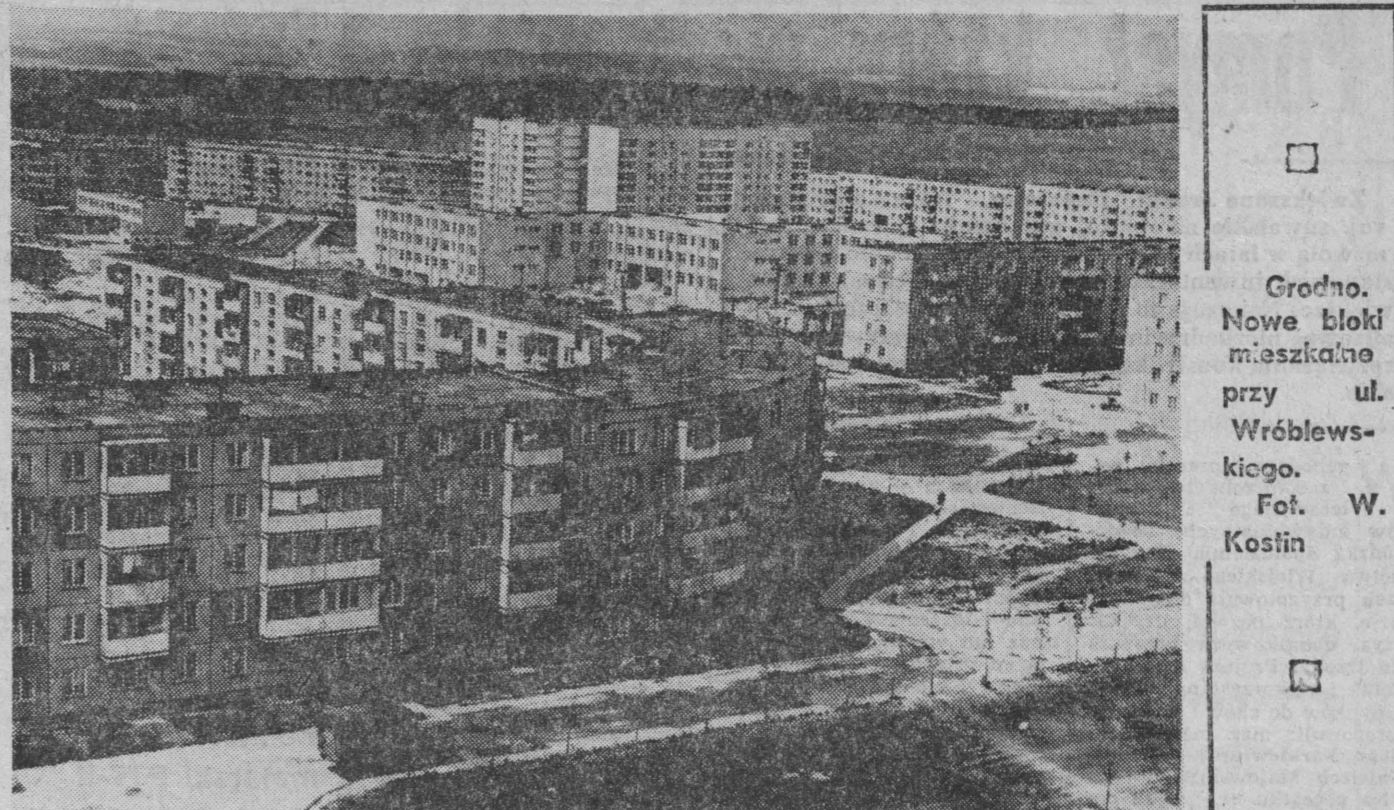
Grodno. Nowe bloki mieszkalne przy ul. Wróblewskiego. Fot. W. Kostin

zaniach określonego typu czynności, lecz jako problem osobowości, której wszechstronny rozwój jest niezbędnym czynnikiem postępu całego społeczeństwa. Nowy człowiek — to obywatel radziecki, legitymujący się naukowym światopoglądem, odnoszący się do pracy, nowator w swym zawodzie. W związku z tym, jednym z wykładników oblicza społecznego kolektywu staje się poziom jego wykształcenia i kultury. Według danych z 1 stycznia ubiegłego roku — 53 proc. pracowników kombinatu mogło wylegitymować się ogólnym średnim i wyższym wykształceniem. Obecnie w szkołach dla młodzieży pracującej, techników i wyższych uczelniach zdobywa wiedzę i kwalifikacje ponad 750 osób. Dzięki temu pod koniec bieżącej pięciolatki ponad 60 proc. załogi zakładu będzie posiadać świadectwa ukończenia średnich i wyższych szkół.