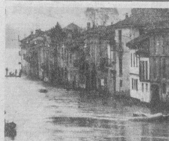
Wioszczyk w dalszym ciągu trwa groźna sytuacja powodziowa, co najmniej 16 osób zginęło, uszkodzonych zostało wiele dróg i mostów. NA ZDJĘCIU: miasteczko Borgo Ticino zalane powodzią.