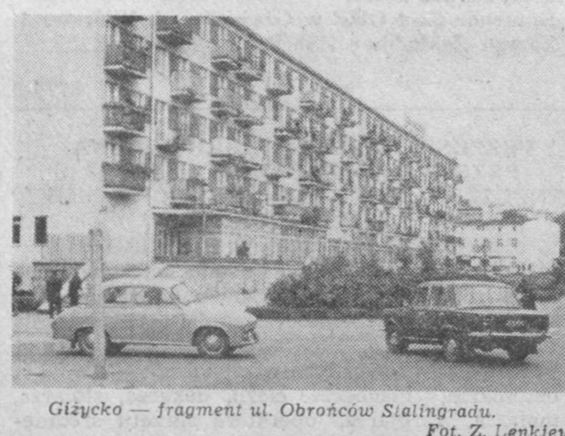
Grajewo — fragment ul. Obrońców Stalingradu.

Miejsko - gminna organizacja ZSMP w Grajewie przeprowadza obecnie kampanię sprawozdawczą - wyborczą w swoich kołach. Młodzież, oceniając dotychczasową swoją działalność, podejmuje konkretne plany dalszej pracy polityczno - organizacyjnej, uwzględniając potrzeby swego terenu i środowiska. Na wielu zebraniach kół ZSMP podkreśla się liczny udział młodych w akcji „Każdy kłós na warę zioła”. Uczestniczyło w niej ponad 300 członków. Na uznanie zasłużyła koła ZSMP w Sołczyne Borowym i Popowie oraz przy OHP w Danówku. Na zebraniach młodzież wybiera nowe władze kół ZSMP. (mar)