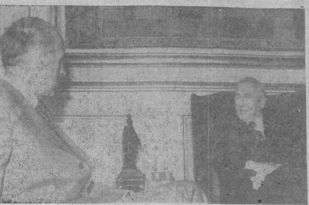
Rozmowy w Pałacu Elizejskim.

WARSZAWA (PAP) — Na zaproszenie kanclerza federalnego dr BRUNO KREISKY'EGO w dniach 16 — 18. 9. br. złoży wizytę nieoficjalną w Austrii prezes Rady Ministrów PIOTR JAROSZEWICZ. W trakcie wizyty kontynuowany będzie, prowadzony od szeregu lat między szefami rządów PRL i Austrii dialog obejmujący zarówno problematykę polsko-austriackich stosunków dwustronnych, jak i wzajemnych zagadnień polityki międzynarodowej.