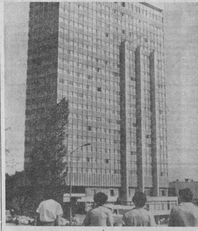
BULGARIA — hotel „Moskwa” w Sofii.

WARSZAWA (PAP) — W dniu 29 bm. nastąpiło w Warszawie podpisanie między Bankiem Handlowym w Warszawie S.A. a konsorcjum banków Republiki Federalnej Niemiec ramowej, umowy kredytowej na sumę 2 miliardów marek z przeznaczeniem na sfinansowanie dostaw z RFN urządzeń do zagazowania węgla i chemicznego przetwarzania gazu w Polsce. Kredyt ten objęty jest gwarancją rządu RFN i stanowi decydującą część programu finansowego w wysokości 2,5 miliarda marek. Ta, najważniejsza dotychczas operacja kredytowa na sfinansowanie eksportu RFN do Polski, jest wynikiem ustaleń dotyczących rozwoju współpracy gospodarczej PRL i RFN, jakie nastąpiły w czasie spotkania pierwszego sekretarza KC PZPR Edwarda Gierka z kanclerzem RFN Helmutem Schmidtem w ub. roku.