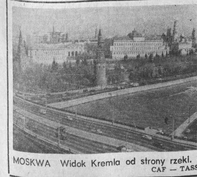
MOSKWA Widok Kremla od strony rzeki.