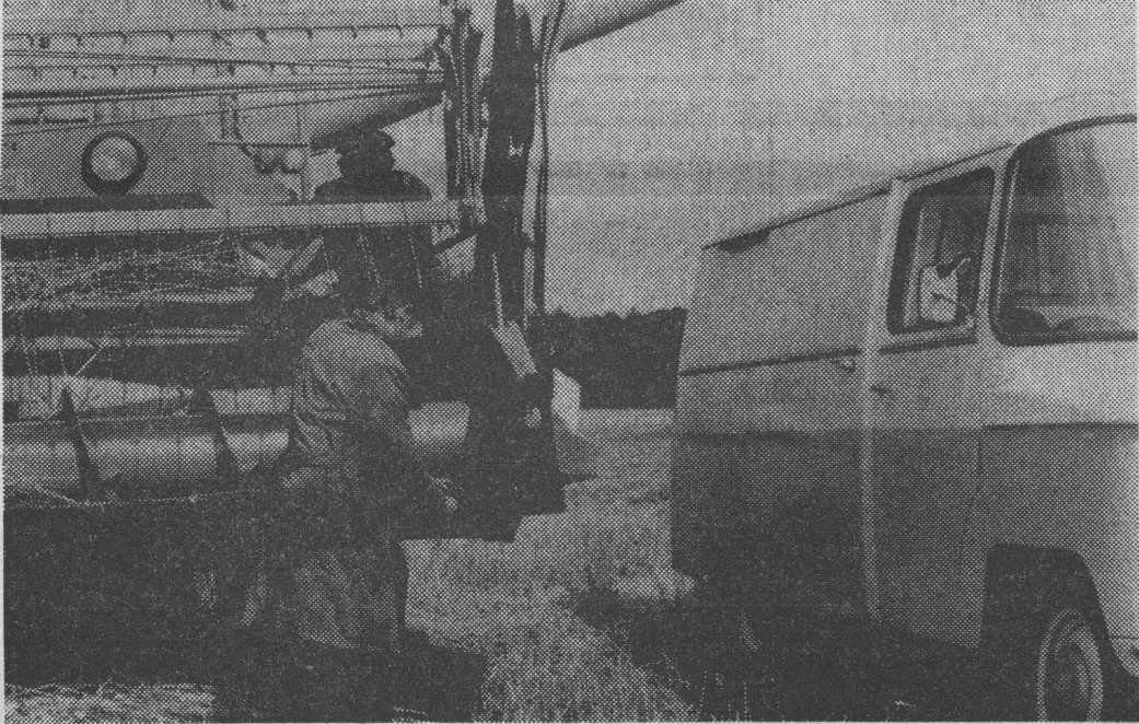
Fachowa ręka mechanika usuwa uszkodzenie podajnika i „Bizon” po chwili znowu ruszy do pracy.

Sztandar dla kolneńskiej organizacji partyjnej Aktyw partyjny miasta i gminy Kolno wystąpił i inicjatywą ufundowania sztandaru dla Komitetu Miejsko-Gminnego PZPR. Przekazanie sztandaru będzie połączone z wręczeniem 1500 legitymacji członkowskiej. Obecnie kolneńska organizacja partyjna liczy 1.448 członków i kandydatów skupionych w 87 organizacjach. W br. do PZPR przyjęło 57 osób, w tym dziewiętnaście kobiet. Wśród przyjętych kandydatów jest 28 rolników i piętnastu robotników. Najwięcej kandydatów przyjęły POP w Fabryce Przyrządów i Uchwytów, Oddziale WSS, Zakładzie Doskonalenia Zawodowego, Zakładzie Gospodarczym WZSR oraz w Glinkach. Przewiduje się, że w najbliższym czasie nowe organizacje partyjne utworzone zostaną w Ważkach i Kollmagach. Podobnie zaktywizowane powinno być środowisko młodziwe. Stanowczo zbyt mała jest ilość kandydatów rekomendowanych przez ZSMP. Tymczasem jest wielu ofiarnych i zaangażowanych młodych ludzi w Zakładzie Mleczarskim, Oddziale Wojewódzkiej Usługowej Spółdzielni Pracy, Rejonie WPHW oraz wielu młodych rolników w wielu wsiach. (Jf)