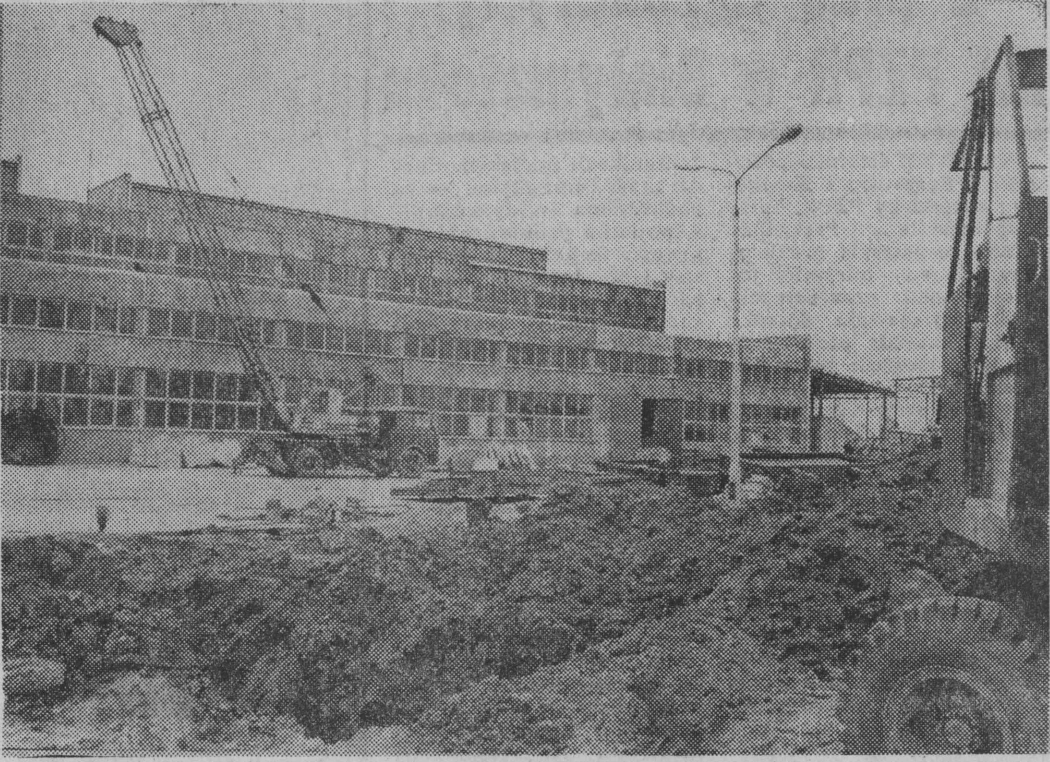
Olecka Fabryka Domów wytwarzać będzie około 3 tys. izb mieszkalnych rocznie.

Budowlani z oleckiego PBRol traktują tę inwestycję jako najważniejszą z wszystkich przez siebie realizowa-