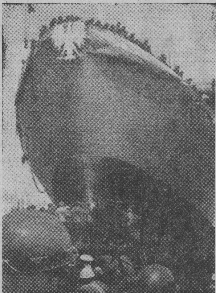
W Stoczni Szczecińskiej im. A. Warskiego spłynął na wodę pierwszą zbudowany w naszym kraju prom pasażersko-samochodowy. Jednostka ta przeznaczona jest dla najmłodszego armatora — Polskiej Żeglugi Bałtyckiej. NA ZDJĘCIU: m/f „Pomerania” na moment przed opuszczeniem pochylni.

Już minione pięć lat było okresem szczególnie intensywnego rozwoju przemysłu spożywczego, na który wydat-