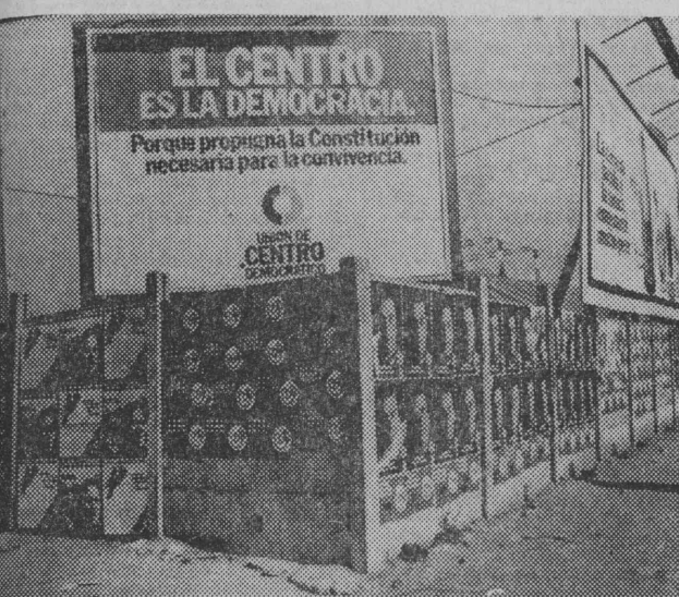
W Hiszpanii trwa kampania wyborcza. Na zdjęciu — plakaty głównych partii politycznych na madryckiej ulicy.