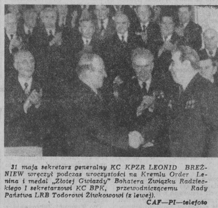
31 maja sekretarz generalny KC KPZR LEONID BREŻNIEW uroczyście podczas uroczystości na Kremlu Order Lenina i medal „Złotej Gwiazdy” Bohatera Związku Radzieckiego i sekretarzowi KC BPK, przewodniczącemu Rady Państwa LRB Todorowi Żiwkowowi (z lewej).

KOPENHAGA — Nad Danią na podniecie od Viborgu rozbił się samolot typu „Super Sabre 100”, należący do duńskiego lotnictwa wojskowego. Dwuosobowa załoga samolotu poniósła śmierć.