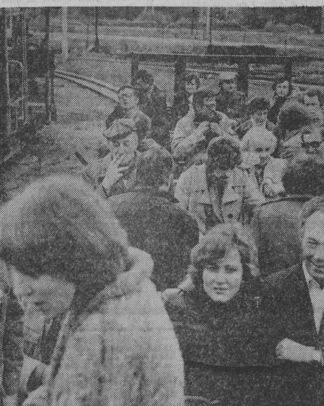
Do atrakcji Festiwalu należał przejazd kolejką leśną przez puszczy.