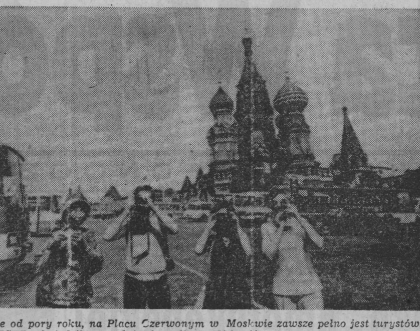
ZSSR. Niezależnie od pory roku, na Placu Czerwonym w Moskwie zawsze pełno jest turystów. W ubiegłym roku ZSSR odwiedziło ponad 4 mln osób ze 155 krajów. NA ZDJĘCIU: turyści w Moskwie.

W ramach przygotowań do alertu naczelnika ZHP dokonano w woj. suwalskim podsumowania „Harcerskiego Raportu” — 1977, celem którego było podjęcie wielostronnych działań związanych z Miesiącem Pamięci Narodowej.