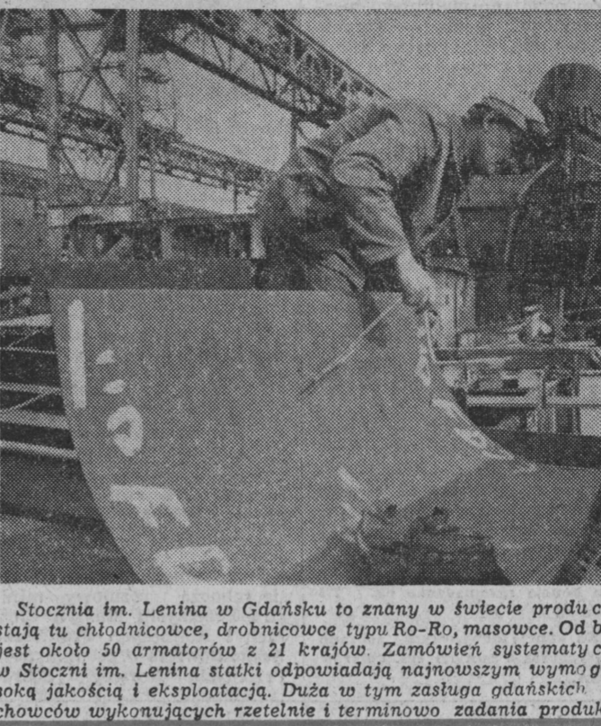
Stocznia im. Lenina w Gdańsku to znany w świecie producent statków specjalistycznych. Powstają tu chłodnicowce, drobnicowce typu Ro-Ro, masowce. Od biorcami tych wszystkich jednostek jest około 50 armatorów z 21 krajów. Zamówień systematycznie przybywa, jako że budowane w Stoczni im. Lenina statki odpowiadają najnowszym wymogom technicznym, odznaczają się wysoką jakością i eksploatacją. Dużą w tym zasługą gdańskich stocznicowców — doskonałych fachowców wykonujących rzetelnie i terminowo zadania produkcyjne.