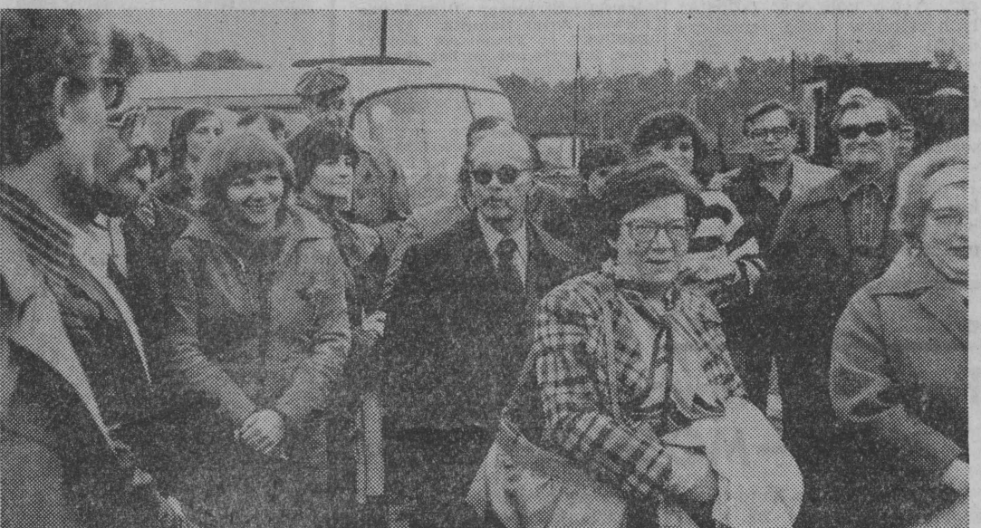
W oczekiwaniu na ognisko.