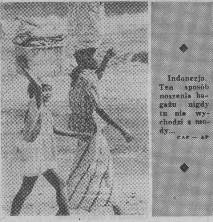
Indonezja. Ten sposób noszenia bągaju nigdy tu nie wychodzi z mody...