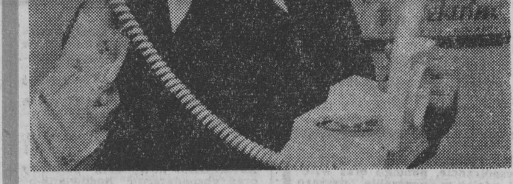
aparatu telefonowego. Już obecnie prowadzi się prace nad przyszłościowym aparatem elektronicznym, którego produkcja uruchomiona będzie w latach 1980-81. Na razie prezentujemy retro — bowiem moda na rzeczy w zupełnie starym stylu — trwa. NA ZDJĘCIU: najnowszy aparat typu „Retro”, który zejdzie z taśm produkcyjnych jeszcze w tym roku.

Niedawnym szlagierem Radomskiej Wytwórni Telefony stał się nowoczesny aparat „Tulipan”, a już w przygotowaniu jest nowy typ aparatu „Retro”. Najnowsze telefony będą kopiami najstarszych modeli z czasów Grahama Beella, który w 1876 roku opatentował urządzenie, które do dziś pod nazwą telefonu. Biuro konstrukcyjne radomskiej placówki prawie co roku wypuszcza nowy model