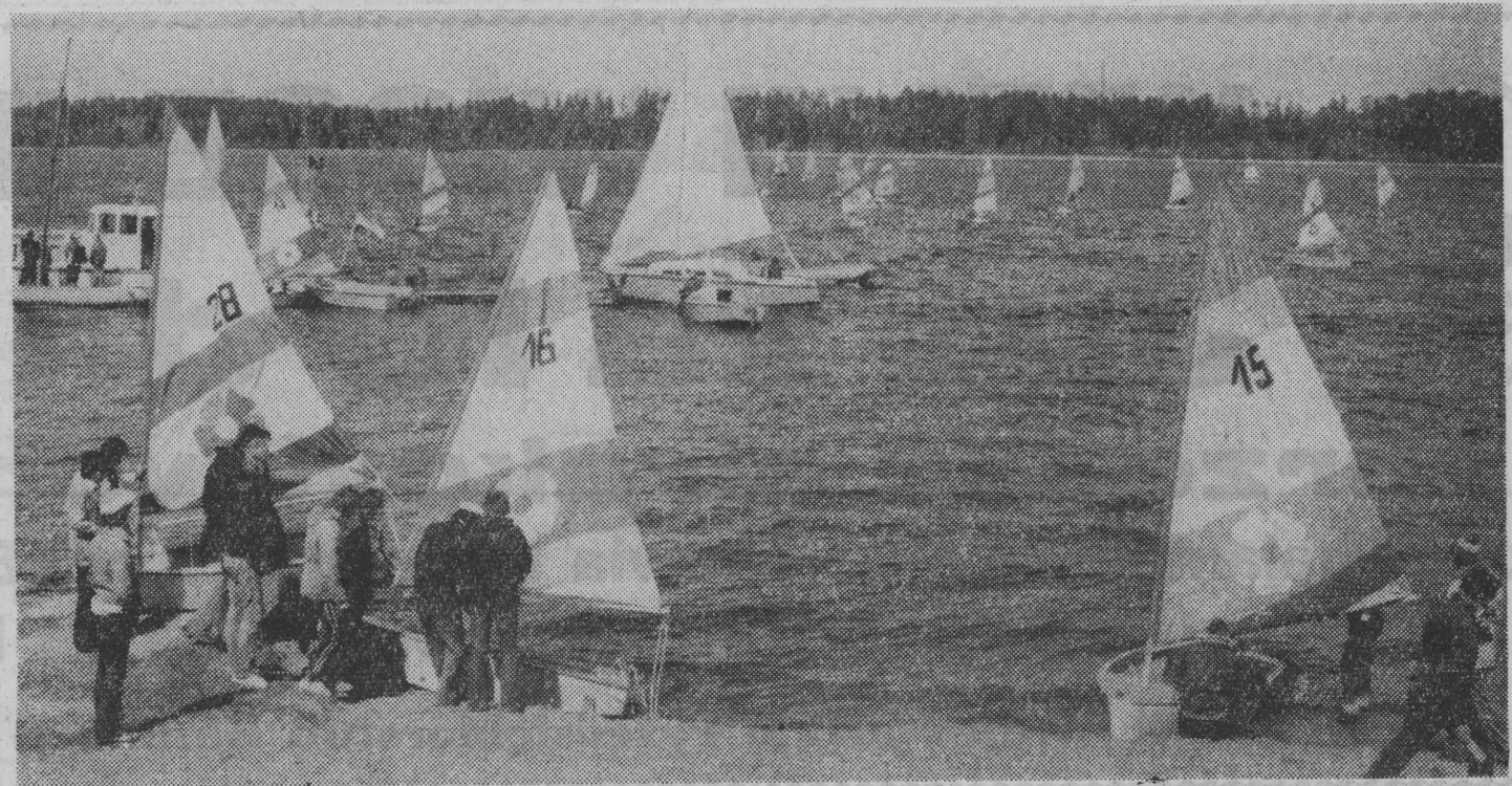
8 i 9 maja żeglarze zapraszają nad Necko

W czasie ostatnich wyborów parlamentarnych w Belgii mieszkańcy przemysłowego miasta Charleroi mogli oddawać głosy m.in. na partię o nazwie „Królowa Śnieżka i Siedmiu Krasnoludków”. Jest to ledwo z wielu grup walczących o ochronę środowiska naturalnego człowieka. (PAP)