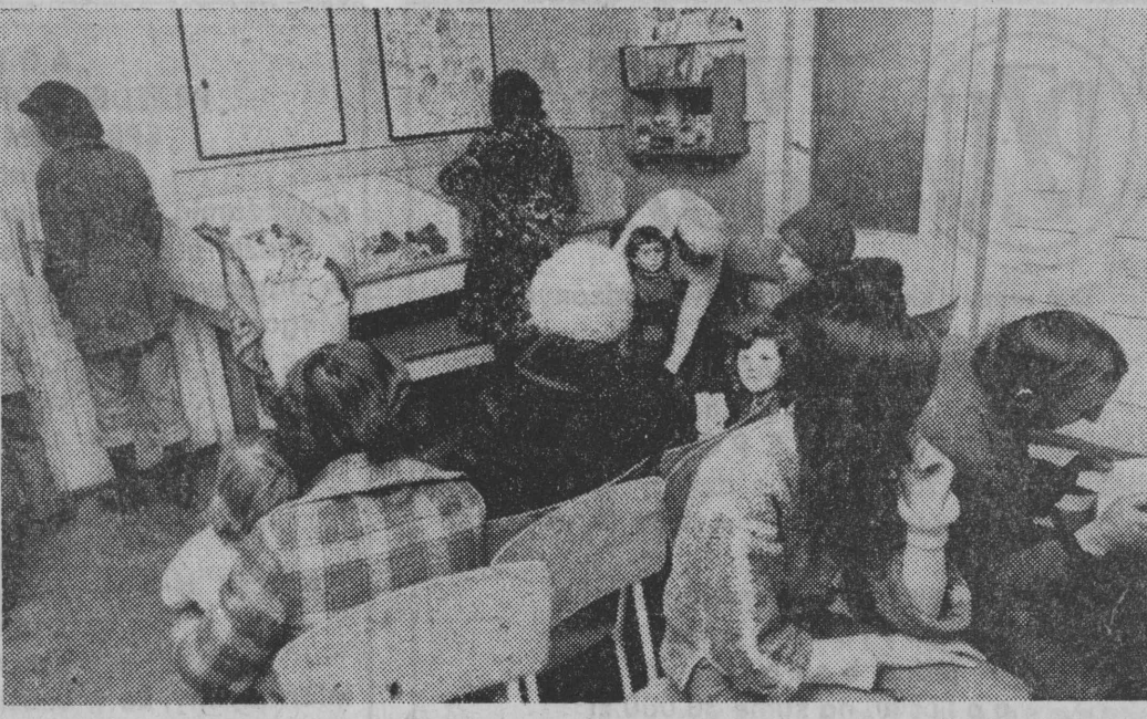
Przez poczekalnię trudno przejść, nie zważając o czy jest nogi.