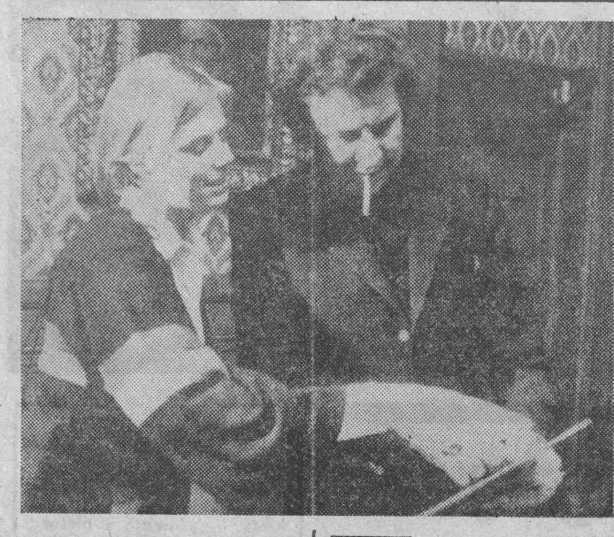
Do Sotokholmu przybył ze swoim zespołem na kilka koncertów znany grecki kompozytor Mikis Theodorakis.