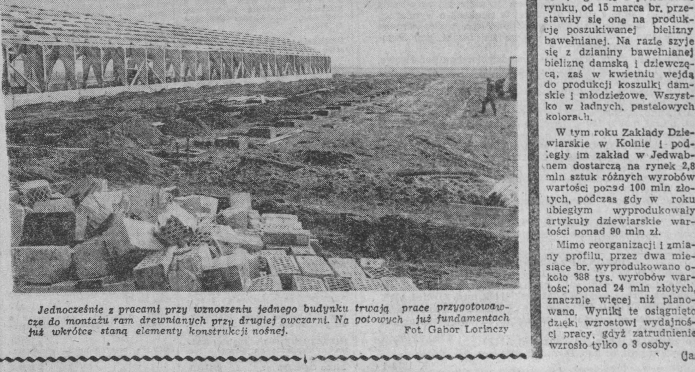
Jednocześnie z pracami przy wznoszeniu jednego budynku trwają prace przygotowawcze do montażu ram drewnianych przy drugiej odczarni. Na potowych już fundamentach już wkrótce staną elementy konstrukcji nośnej.

Na początku bieżącego roku w pobliżu NOWOGRODU (woj. łomżyńskie) rozpoczęto budowę dwu nowoczesnych odczarni na 700 stanowisk każda. Koszt realizacji obu obiektów wyniesie ok. 5 mln złotych. Budowane kompleksy hodowlany zostanie ponadto uzupełniony obiektami pleks hodowlany jak garaże na ciągniki, duży magazyn paszowy. Wykonawcą inwestycji jest Rejonowy Zakład Budownictwa Wiejskiego w Nowogrodzie. Budynki odczarni montowane są z jednolitych elementów drewnianych. Pozwoli to na uzyskanie pomieszczeń o wszystkich walorach użytkowych. Przestrzeń pomiędzy elementami konstrukcyjnymi zostanie wypełniona cegłą o dobrych właściwościach izolacyjnych. Zastosowanie konstrukcji z ram drewnianych pozwoli ponadto na znaczne skrócenie cyklu inwestycyjnego, ustalanie dla tego typu budowl przy zastosowaniu technologii tradycyjnej. Wszystkie obiekty kompleksu hodowlanego zostaną oddane do użytku w II kwartale przyszłego roku. Na przekazywanie do użytku w II kwartale przyszłego roku planuje się rozpocząć (nom) hodowl.