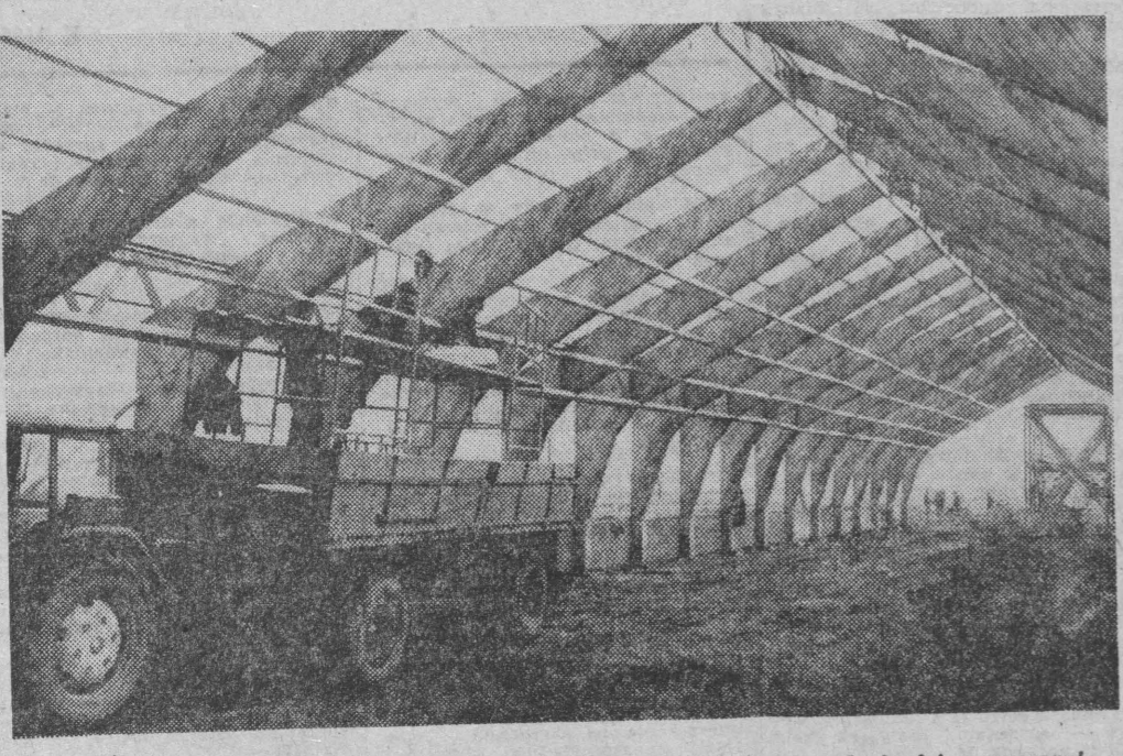
Zakończono już montaż elementów konstrukcyjnych w jednym z budynków odczarni. Obecnie trwają tu prace przy zakładaniu pokrycia dachowego.