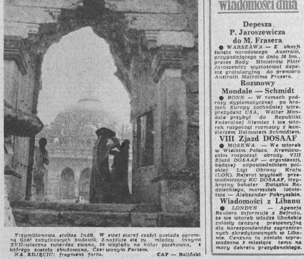
Trzymilionowa stolica Indii. W swej starej części posiada ogromną ilość zabytkowych budowli. Znajduje się tu między innymi XVII-wieczna tutejsza zwanna, ze względu na kolor płaskowca, z którego została zbudowana. Czerwonym fontem.