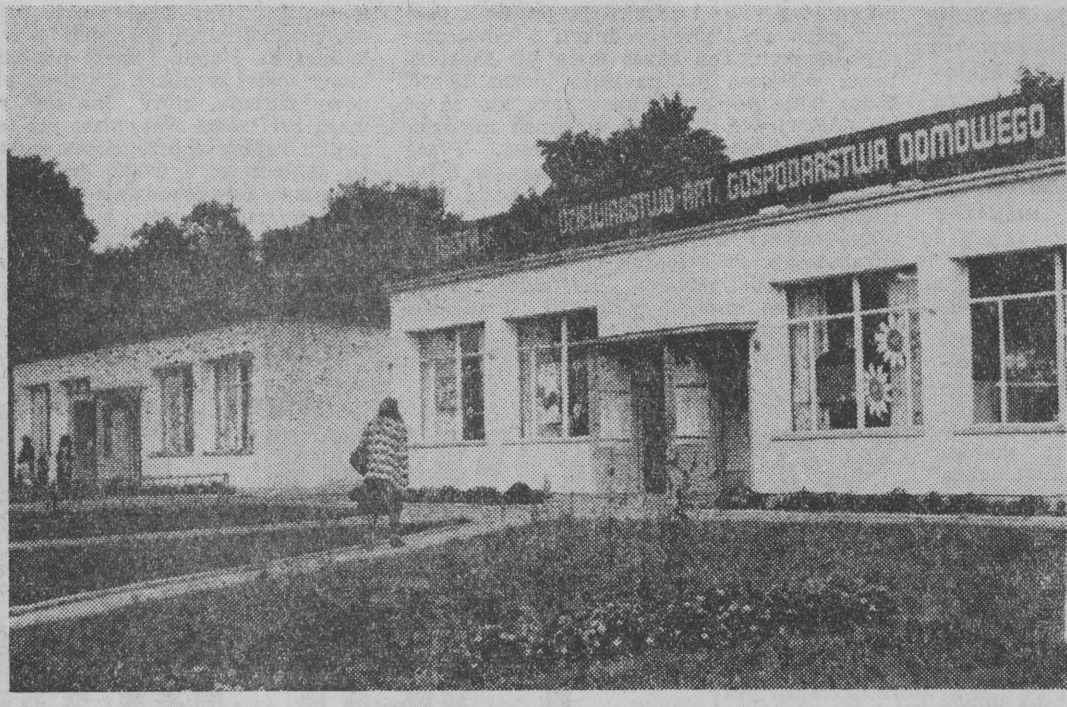
NA ZDJĘCIU: Krukanki, woj. suwalskie — pawilony handlowe.

Sa to największe cmentarze wojskowe w woj. suwalskim, ale pamiętać są bezdnie także i o pojedynczych mogiłach, gdzie leżą znani i nieznani. Na Święto Zmarłych wszystkie te miejsca odwiedzić młodzież szkolna i harcerze. (jas)