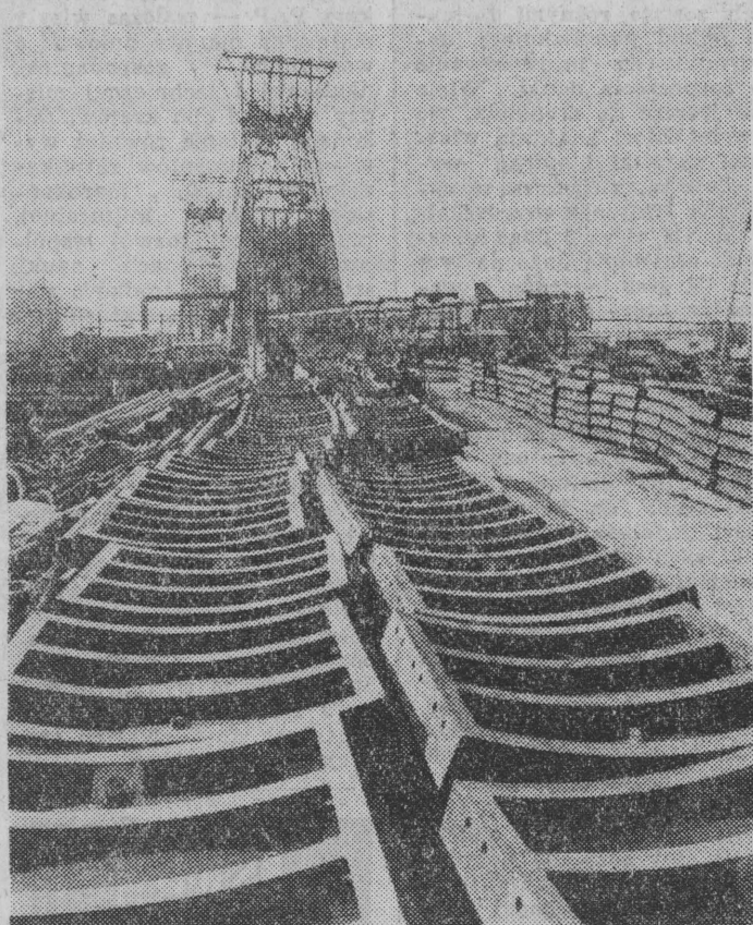
Wokół sztywów pływająco-wydobywczej kopalni w Bogdanie trwa robota budowa zaplecza. Ale najważniejszą częścią pracy toczy się pod ziemią, gdzie wyłożonych samochodów z urzeczami górnictwa i szybów, które odbywa się już na dużych głębokościach. Zmusza to budowlanych do stosowania tubingów — stalowych pierścieni opasujących ścianę szybu.

Na obecnym etapie rozwoju gospodarki narodowej ZSRR na pierwszy plan wysuwa się problem podniesienia efektyw-