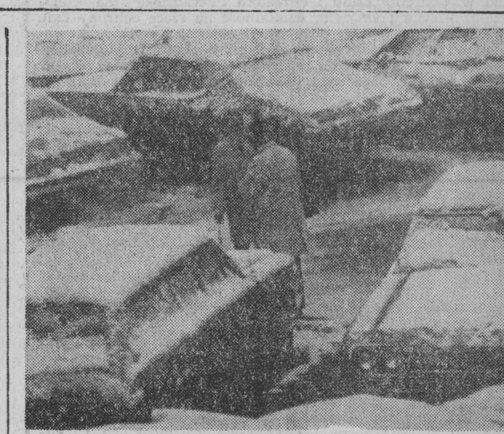
Amerykańskie miasto Denver nawiedziła 26 bm. pierwsza w tym roku burza śnieżna. Warstwa śniegu miała około 10 cm grubości.

Wszystkie poczynania w oświacie, a w tym również w działalności ogniw ZNP —