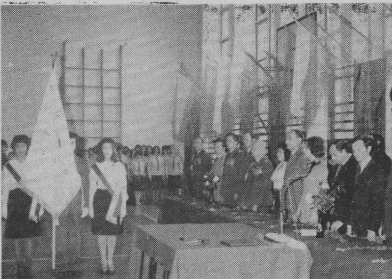
W chwilę po wręczeniu sztandaru.