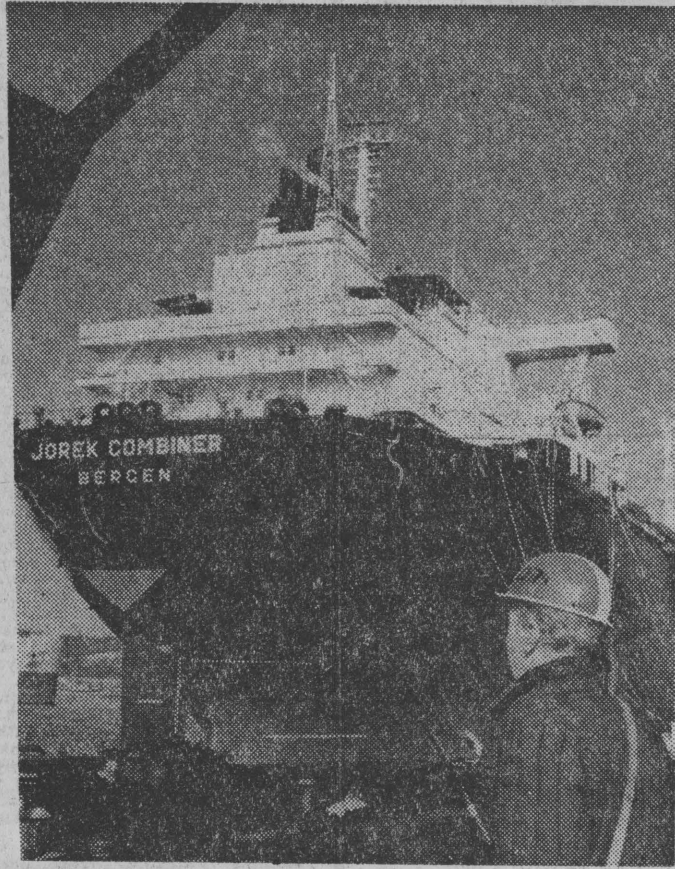
„Jorek Combiner” — statek typu OBO o nośności 117 tys. ton, jest największą jednostką morską zbudowaną przez nasz przemysł okrętowy. Przekazała go niedawno armatorowi norweskiemu Stocznia im. Komuny Paryskiej w Gdyni. Drugi, tego typu statek otrzyma odbiorca norweski w przyszłym roku.

NA ZDJĘCIU: „Jorek Combiner” przy nabrzeżu wyposażeniowym. CAF—Uklejewski