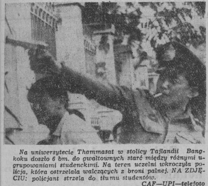
Na uniwersytecie Thammasat w stolicy Tajlandii Bangkok doszło 6 bm. do gwałtownych starć między różnymi ugrupowaniami studenckimi. Na teren uczelni uderzyła policja, która ostrzelała walczących z broni palnej. NA ZDJĘCIU: policjant strzela do tłumu studentów.