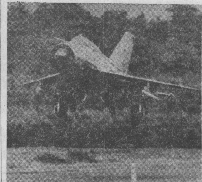
W ramach rozgrywanych ćwiczeń „Tarcza-76” piloci pułku myśliwskiego „Kruków” wykorzystali do startów i lądowania odcinek drogi publicznej. Na ZDĘCIU: lądowanie nadźwiękowego samolotu MiG-21 na szosie.