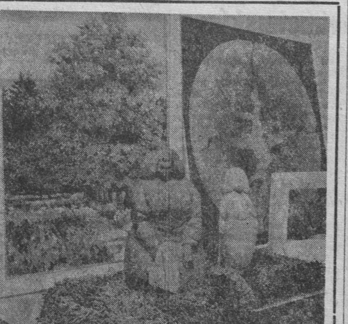
Prace plastyczne widoczne na zdjęciu stanowią będą przedmiot aukcji, która odbędzie się w Rotundzie w najbliższą sobotę.

cie wystawy nastąpi jutro o godz. 18. Czynna ona będzie codziennie (oprócz niedzielnych) w godz. 10—17, w czwartki w godz. 12—19, a w niedzielę w godz. 11—16. Serdecznie zachęcamy wszystkich gości naszego święta, mieszkańców Białostoku, a zwłaszcza młodzież szkolną do obejrzenia tych interesujących ekspozycji. W numerze jutrzejszym kolejny bogaty zestaw propozycji dla naszych Czytelników. K. PROCHNIEWICZ