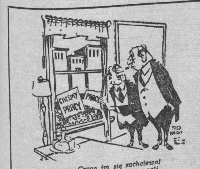
— Czego im się zachciało? Myśmy nigdy nie pracowali.

Według najnowszych szacunków, w Arabii Saudyjskiej eksploatacja ropy na wysokim poziomie trwać będzie przynajmniej do ok. 1990, po czym zasoby naty — drugie pod względem wielkości na świecie — ulegną wyczerpaniu. Dla Kuwejtu, Libii, Abu Dhabl i Omanu wyliczone okres intensywnej eksploatacji ropy do roku 2030, dla Algierii — do roku 2100. Znaczenie wczesniej jednak cały ten region stanie się prawdopodobnie jednym z większych w skali światowej