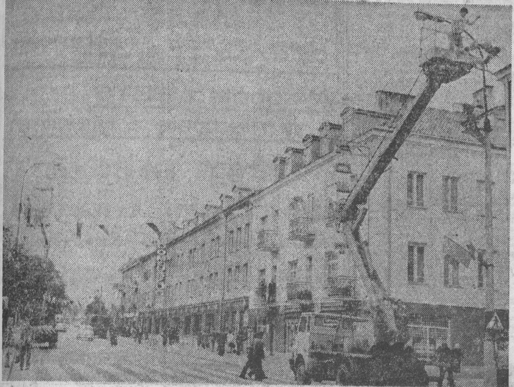
Rynek Kościuszki i przyległe ulice przybierały odświętną szatę. Już jutro o godz. 10 zainaugurowane tu zostaną liczne imprezy Wielkiego Festynu Prasowego.

Sprawił nam wielką satysfakcję, że był wśród nas na ćwiczeniu, że przybył również na dzisiejsze uroczyste spotkanie zawsze bliski żołnierskim sprawom i dla sprawnego przebiegu ćwiczeń. Ciąg dalszy na str. 2