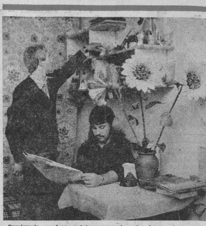
Przyjemnie urzędować i dobrze wyposażone dwa-trzyosobowe pokoje sprzyjały nie tylko uśmiechowi, ale i wypoczynkowi.

dydaktów) oraz egzamin ustny z matematyki i fizyki. Lista nowo przyjętych zostanie ogłoszona 23 bm. Tego też dnia rozpoczyna się zajęcia na PB. Wyjątek stanowi Instytut Mechaniki, który zaczyna swój rok akademicki 27 bm. Filia UW dysponuje 80 miejscami na kierunku matematyki (zgłosiło się 100 kandydatów) oraz 40 miejscami na kierunku fizyki, na który kandyduje tylko 40 osób. Obowiązują egzamin pisemny z przedmiotu kierunkowego i języka obcego oraz ustny z fizyki i matematyki. Jedną dwójkę z egzaminu pisemnego nie eliminuje, a więc powodzenia. (fm)