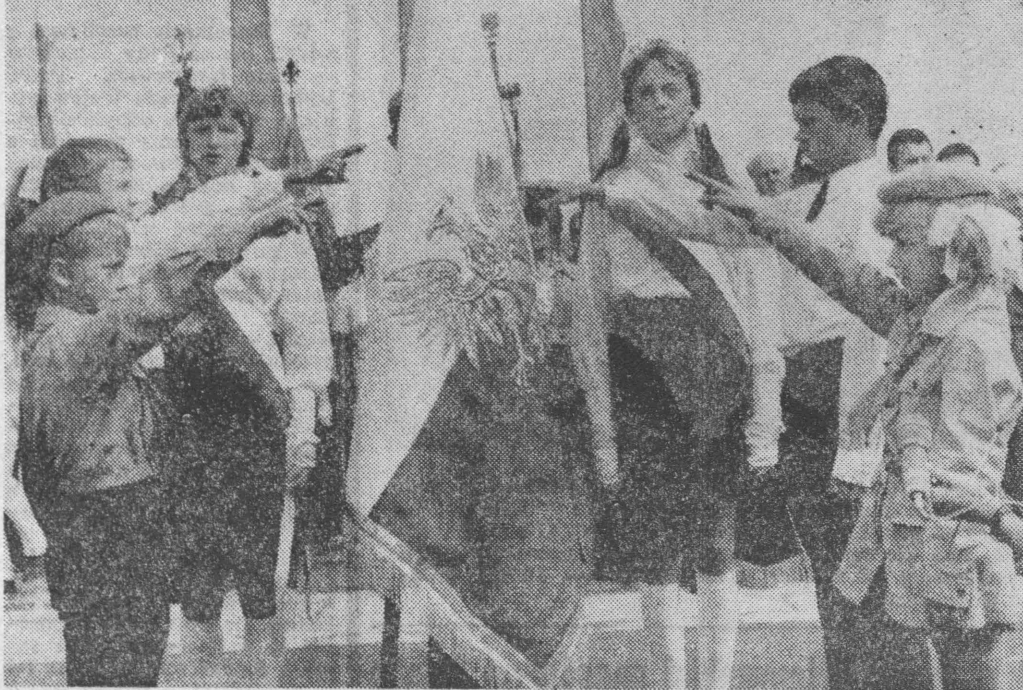
Moment uroczystego ślubowania na szkolny sztandar.