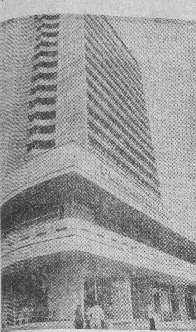
Co roku Bulgaria, która stała się prawdziwą potęgą turystyczną, odwiedza ją około pół miliona, co nie jest dziełem przypadku. Turystyka stała się jedną z ważnych gałęzi gospodarki narodowej. Ciągłe buduje się nowe hotele i pensjonaty w znanych kurortach i w całkiem nowych, jeszcze mało popularnych ale pięknie położonych miejscowościach nad morzem i przede wszystkim w górach, a także w miastach, które turyści zwiedzają „po drodze”. Przewiduje się, że w tym roku Bulgaria odwiedzi ok. 4,5 mln turystów.

NA ZDJĘCIU: nowy hotel „Riga” w naddunajskim mieście Russ.