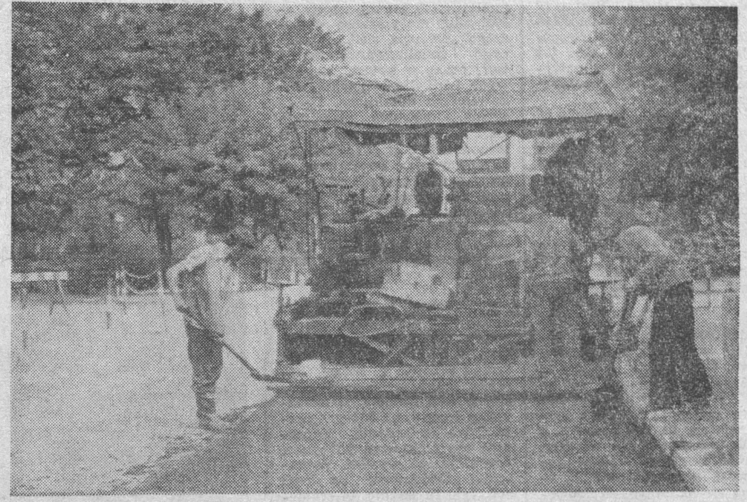
Rejon Budowy Dróg i Mostów z Bielska Podlaskiego asfaltuje ulice w Boćkach.

W roku bieżącym prace przy budowie tych potrzebnych urządzeń ruszyły z miejsca. Niedawno Osiedle