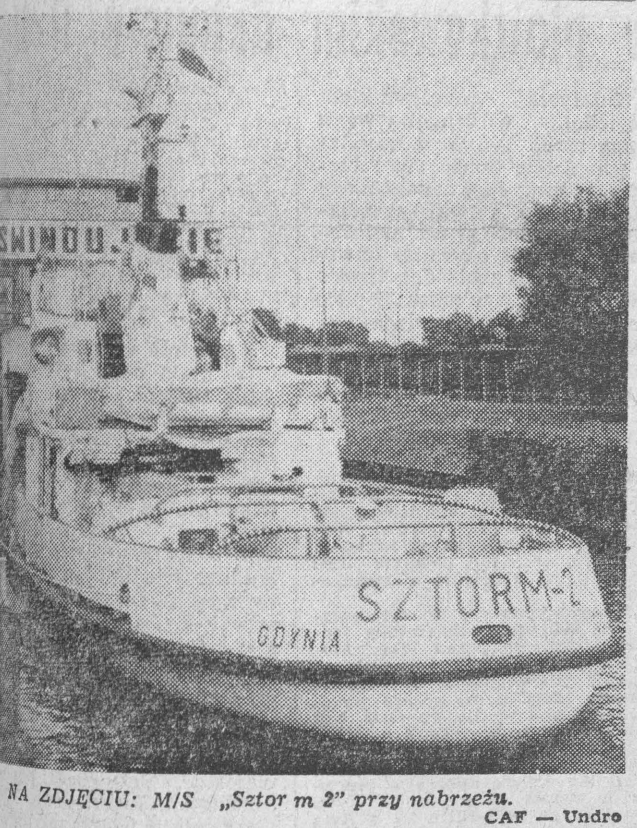
NA ZDJĘCIU: MIS „Sztorm 2” przy nabrzeżu.

Wielkie Ratownictwo Okręgowe otrzymało czwartą z serii, nowoczesną jednostkę ratowniczą — MIS „Sztorm 2”. Statek został przystosowany do ratowania ludzi i zwierząt, posiada także możliwość zwiezienia innych jednostek ratowniczych. Wysokość kadłuba wynosi 10,5 m, długość 24 m, szerokość 6 m. Wyposażony jest w wiele nowoczesnych urządzeń, takich jak: przenośnik do obrony przed ogniem, pożarowy na pokładzie, pompy ratownicze, przenośnik z napędem elektrycznym i własnym, elektrycznym.