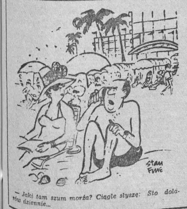
— Jaki tam szum morza? Ciągłe słysze: Sto dolarów dziennie...

Nasilenie publicznej krytyki i samokrytyki, zwiększenie ich roli uważa się za sprawę nieodzowną. Dokument Biura Politycznego „popodpowiada” i formułuje je zjawiska społeczne, które szczególnie proszą się o krytyczną ingerencję środków masowego przekazu. Oczwista, że żadnych realnych efektów nie osiąga się drogą wyrażania tzw.