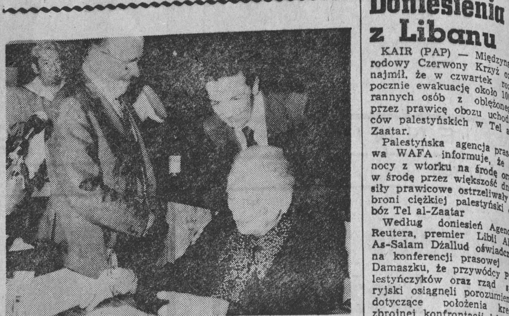
28 lipca odbyło się w Rzymie posiedzenie KC Komunistycznej Partii Hiszpanii. NA ZDJĘCIU: przewodnicząca partii Dolores Ibaruri w rozmowie z sekretarzem generalnym Włoskiej Partii Komunistycznej — Enrico Berlinguerem podczas przerwy w obradach. Z lewej — sekretarz generalny KC KP Hiszpanii Santiago Carrillo.

Cląg dalszy ze str. 1 scy ludzie pracy starają się z nich wyciągać wnioski, do to by już nigdy w przyszłości wydarzenia takie nie powtórzyły się, by miasto o chlubnych tradycjach robotniczych mogło spokojnie pracować i rozwijać się. Wszyscy zabierający głos robotnicy akcentowali, że przyłączając większość społeczeństwa Radomia stanowią ludzie uczciwi i solidni, popierający politykę partii i rządu, którym głęboko na sercu leżą sprawy rozwoju kraju i pomyślności miasta, w którym pracują i żyją.