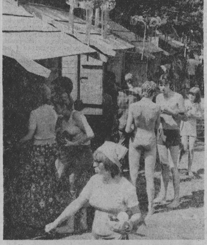
Handel i gastronomia przygotowały się znakomicie. Kiermaszowe stoiska przyciągnęły w związku z tym prawdziwe tłumy...