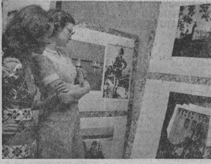
W WDK w SUWAŁKACH czynna jest otwarta w dniach festynu wystawa fotograficzna „Województwo suwalskie”...