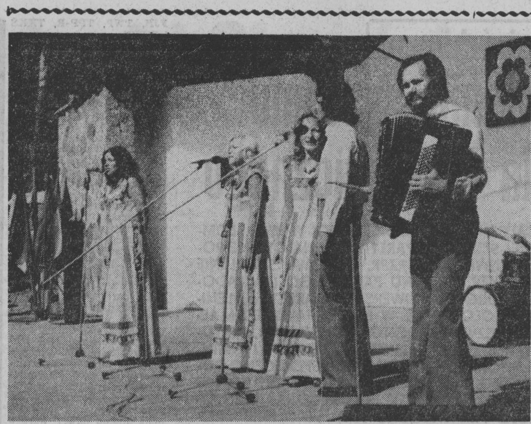
Zespół „Moderato Cantabile” z Sejnu występował w kilku miejscowościach...