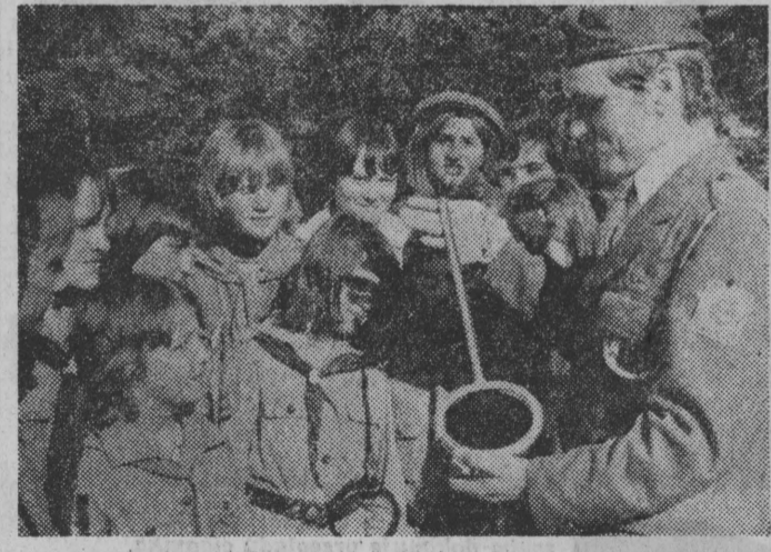
W WĘGORZEWIE harcerze otrzymali w pierwszym dniu festynu symboliczny klucz do bram miasta...