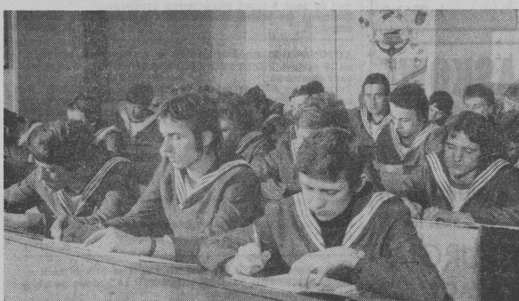
Przed czterema laty powołano Liceum Morskie w Gdyni za stałą bazę na statku szkolnym „Edward Dembowski”. Nauka w tym niecodziennym Liceum trwa cztery lata.

Do niedawna byłem przekonanym, że w Białymostku powstała problematyka wystawy porządnej rzeźby jest niemożliwa. Ostatnie sezony, podczas których uczestniczyłem w porównaniach ekspozycji i etnicznie obfitymi rzeźbami były tym bardziej zenujące, że