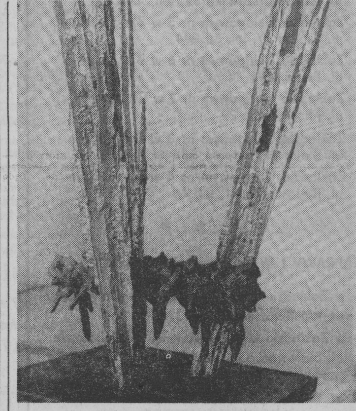
Bronisław Chromy — projekt pomnika partyzantów.

Krajowy Komitet NFOZ, Ministerstwo Oświaty i Wychowania, Ministerstwo Kultury i Sztuki oraz Główna Kwatera Związku Harcerstwa Polskiego ogłosi konkurs rysunków imalarstwa dzieci o tematyce ochrony zdrowia.