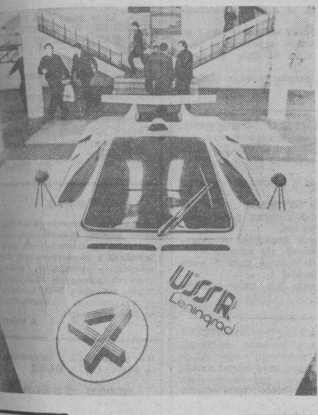
W hali nowej siedziby technikum samochodowego w Leżanowie wystawiono model samochodu wyścigowego zaproszonego przez leżanowski konstruktorów.