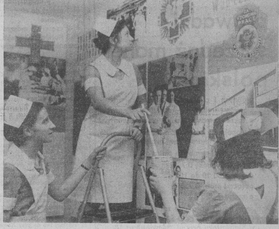
Zaszczytną i chlubną kartę spisał w okresie drugiej wojny światowej pracownicy cywilnej i wojskowej służby zdrowia Białostoccy. Ofiarą nieśli młodzi wojownicy z kampanii wrześniowej, nie zapomnieli o swoich powinnościach z drutami szwedzkimi i koncentracjnymi. Tworzyli medyczne i sanitarne szpitale, byli na wszystkich frontach, uczestniczyli w wielu bitwach. Po wojnie przystąpili do odbudowy i rozbudowy polskiego leśnictwa. Utrwaleniem wysiłku, poświęcenia i ofiarnego trudu pracowników służby zdrowia Ziemi Białostockiej jest nowe powstanie Izby Pamiątek Narodowej, mieszcząca się w gmachu Zespołu Szkół Medycznych w Białymstoku. Zgromadzone w niej blisko 300 eksponatów m. in. — połowy stół operacyjny, mundury sanitariusza i sanitariuszek, instrumenty medyczne, dokumenty, zdjęcia, albumy i odsახнения. W organizowaniu stałej ekspozycji wzięły udział nie tylko naczelnice ale i ostankowe kole ZBoWiD pracowników służby zdrowia. NA ZDJĘCIU: ostatnie poprawki przed otwarciem Izby Pamiątek.

Trzeba stwierdzić, że oceny te były pozytywne. Rady zakładowe coraz aktywniej wiążą się w współgospodarzenie przedsiębiorstwem, o czym świadczą ich udział w pracach samorządów robotniczych, w rozwijaniu współzawodnictwa pracy, w realizacji zadań produkcyjnych, w podejmowaniu i wykonywaniu dodatkowych zobowiązań, zwiększeniu produkcji na rynek wewnętrzny i eksport. Szczególne uwagi poświęcono realizacji uchwał II Plenum KC dotyczących wykorzystywania rezerwy, wprowadzania nowych technologii w produkcji. Ta działalność była owocna w skutkach, a wnioski i postulaty załóg umożliwiły zwiększenie zadań w wielu zakładach. W Przedsiębiorstwie Gospodarki Komunalnej i Mieszkaniowej w Sokółce podwyższono zadania planowe o 8,5 mln złotych, w Bielsku Podlaskim o 4,3 mln zł, Rejonowym Przedsiębiorstwie Wodociągów i Kanalizacji w Białymstoku o 3 mln zł. Dowodem dużego zaangażowania organizacji związkowych w sprawy produkcyjne swoich zakładów, są też dodatkowe zobowiązania podejmowane na zebraniach grup związkowych. Do zakładów tych należą m.in. — Fabryka Sklejek i Fabryka Mebli w Białym-