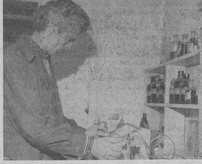
NA ZDJĘCIU: w laboratorium oczyszczalni.

Kierowca zapomniał pamiętać, że za 40 lat, jak dobrze pójdzie, nikt nie nazwie go młodzieńcem. Uczennica liceum (nazwisko i adres znane redakcji)