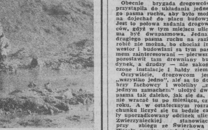
NA ZDJĘCIU: tak wygląda okolica ul. Mistrzów Pionów.