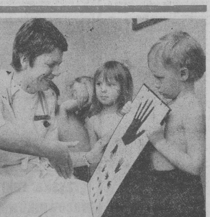
Główny Ośrodek Zdrowia w Lipcu w woj. łomżyńskim obejmuje swym działaniem 15 wsi — w sumie około 6 tysięcy mieszkańców. Trójka lekarzy, położna i trzy pielęgniarki pracują w trzech przychodniach (ogólnej, dziecięcej i stomatologicznej) i poradni dla kobiet ciężarnych. W nowym, zbudowanym kilka lat temu budynku GOZ mieści się jeszcze punkt szczepień, izba porodowa i gabinet zabiegowy. Lekarze z Lipki opiekują się także przedszkolami i dziećmi z rodzinami w swoim terenie.

Spotkanie w Wysokim Mazowieckim było okazją do podsumowania dorobku szkół w programowaniu osiągnięć służby zdrowia. Jak wiadomo młodzież łomżyńska posiada w tym zakresie długi i wieloletni tradycje. Przy Liceum Medycznym Pielęgniarstwa w Łomży od lat działa znany w całym kraju klub przyjaciół starego człowieka. Uczniowie należący do tego klubu po zajęciach w szkole odwiedzają emerytów, rencistów i ludzi samotnych, by pomóc im w zakupach, przy sprzątaniu. Przy tym samym liceum i w innych szkołach działają drużyny sanitarne PCK. Przy Wojewódzkim Zarządzie PCK działa również ponad 80-osobowa grupa społecznych in-