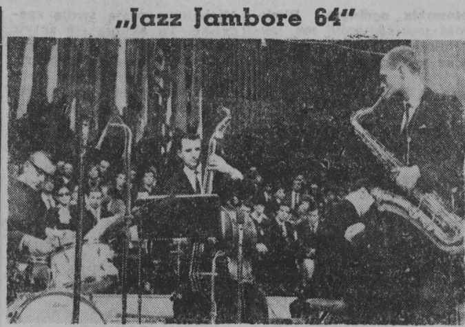
Jak już informowaliśmy w Filharmonii Narodowej w Warszawie rozpoczyna się VII Międzynarodowy Festiwal Muzyki Jazzowej 'Jazz Jambore 64'.