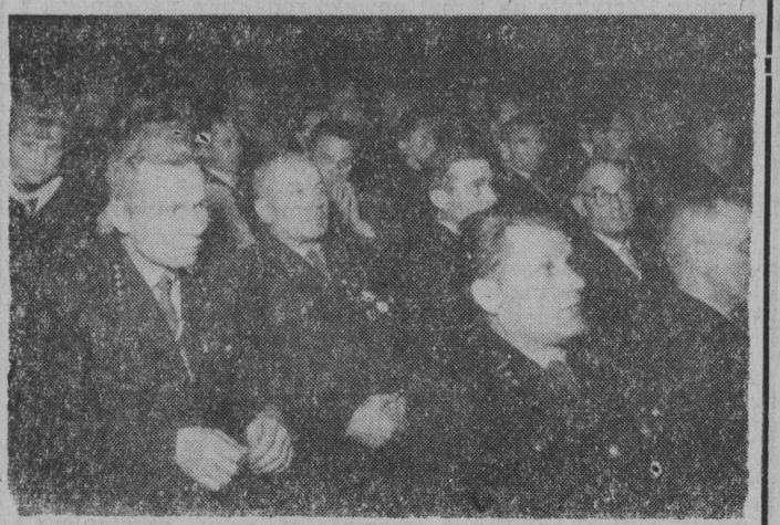
Na widowni sali Kino-Teatru Związków Zawodowych, gdzie odbywała się akademie — wiele osób w mundurach łącznościowców. Przecież to ich święto...

O miejscu spotkania zainteresowani zostaną poinformowani listownie. (ib)