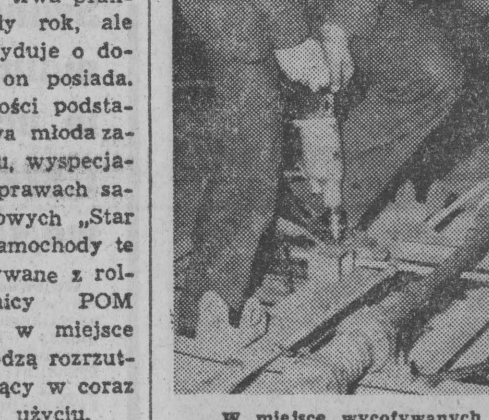
NA ZDJĘCIU: mechanicy samochodowych „Star 25” byli dotychczas główną dziedziną działalności piśkatego POM.