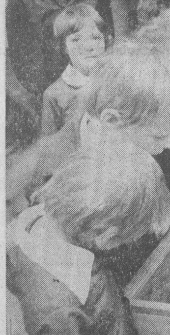
Harcerze przebywają w Izbie Pamięci narodzieli.