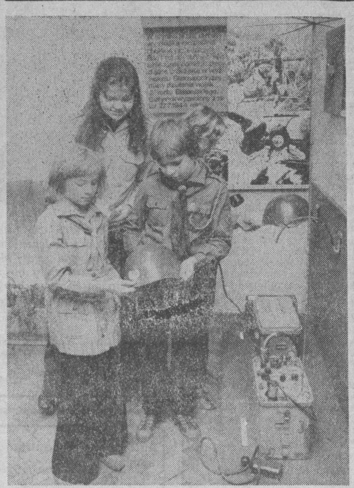
Tu się uczą dzieci.