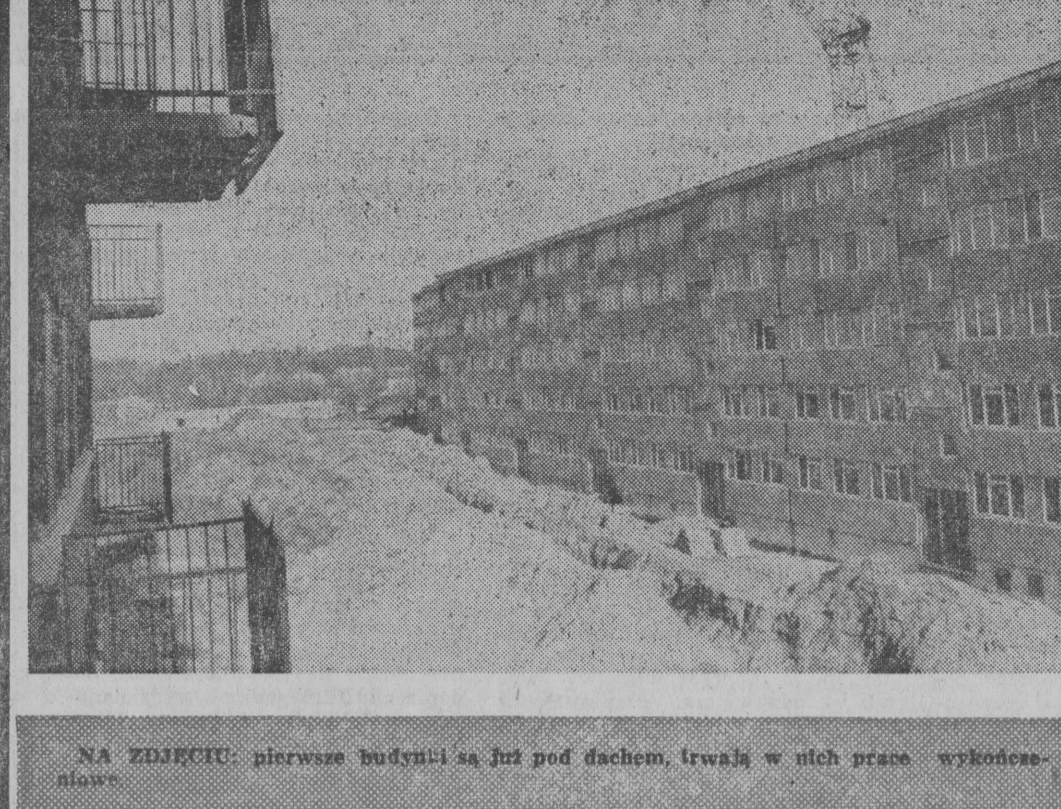
NA ZDJĘCIU: pierwsze budynki są już pod dachem, trwają w nich prace wykończeniowe