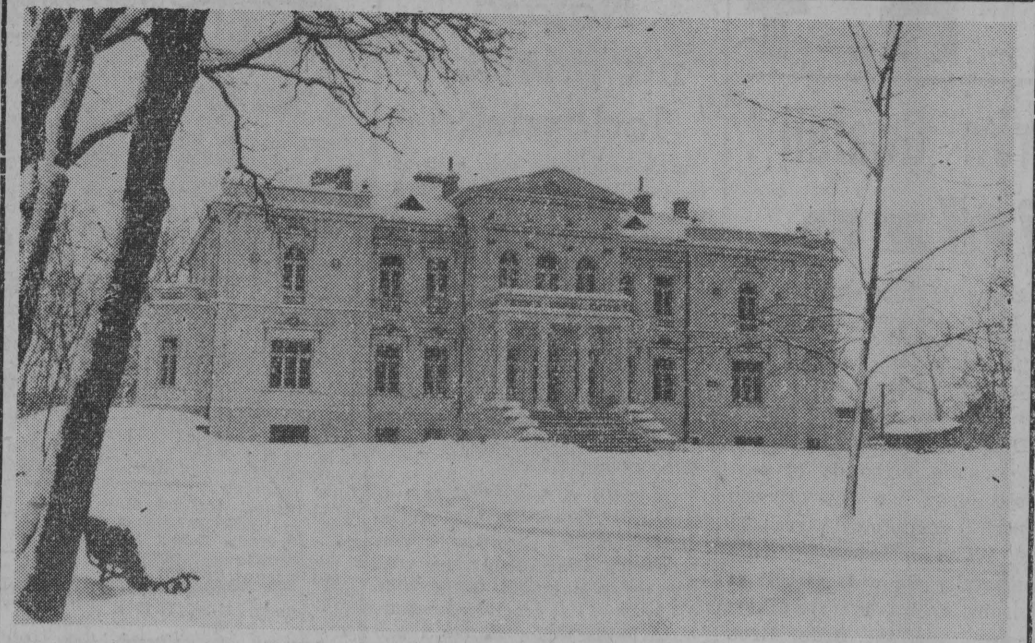
Pięknie wygląda na tle śniegu pałacyk mieszczący Technikum Rolnicze w Dojlidach.

lektury posiadające tytuł, w BZPW im. Sierżana Brygady Pracy Socjalistycznej nie przejawiają większej działalności. Przynajmniej zmniejszonej aktywności ruchu współzawodnictwa — to w pierwszym rzędzie brak należytego zainteresowania się nim ze strony kierownictwa zakładów i wydziałów produkcyjnych, nie zawsze konsekwentne i właściwe ustosunkowanie się do potrzeb współzawodnictwa ze strony samorządu robotniczego i wreszcie zbyt późne podliczanie wyników współzawodnictwa. Utrudniało to, a czasem wprost uniemożliwiało właściwą ocenę pracy brygad, a w konsekwencji zniechęcało do wzmożonych wysiłków współzawodniczących. W większości przedsiębiorstw nie prowadziło się właściwej propagandy wizualnej na rzecz współzawodnictwa, nie było należytego popularyzowania przedowników pracy. Abym przywrócić ruchowi współzawodnictwa pracy właściwą rangę, by uczynić