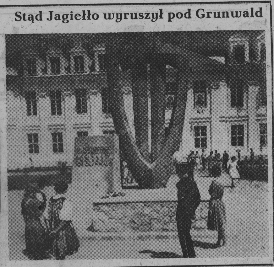
Pomnik w Wolborzu odsłonięty w 550 rocznicę wyjazdu wojsk króla Jagiello pod Grunwald z tego miasta.

Wczoraj rozpoczęła się w Warszawie doroczna konferencja rektorów szkół wyższych. Program obrad, którym przewodniczy minister Szkolnictwa Wyższego — mgr inż. Henryk Gołański, przewiduje m. in. omówienie sytuacji kadrowej w szkołach wyższych, oraz planów i organizacji badań naukowych w ucieleśn. Dyskutowane będą również problemy pracy wychowawczej. W drugim dniu trwania konferencji rektorzy zajmą się m. in. sprawami przyjęć młodzieży na pierwszy rok studiów.