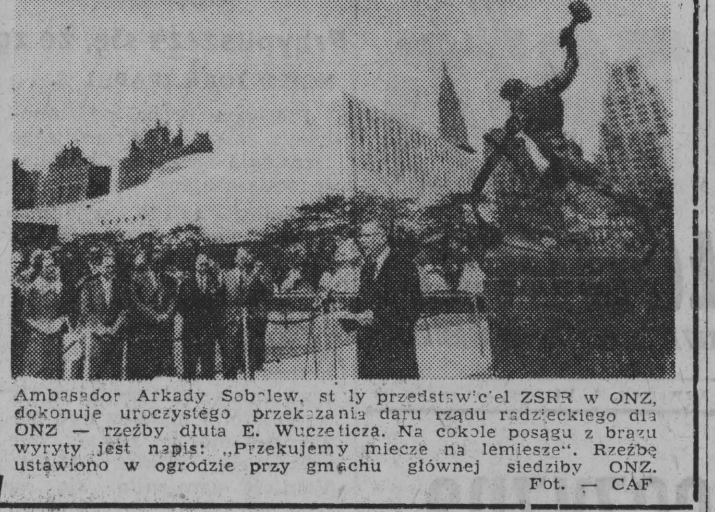
Ambasador Arkady Sobolew... przedstawiciel ZSRR w ONZ...