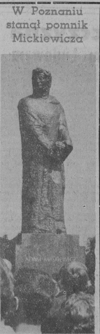
W ramach obchodu 100-lecia urodzin Adama Mickiewicza.

Wytwórni Konstrukcji Stalowych „Konstal” i Fabryki Sprzętu Elektrotechnicznego w Czechowicach rozpoczęły pracę według nowych norm. Nowe normy, których opracowanie trwało blisko rok, oparte są na rzeczywistych możliwościach ich wykonania. Pozwolą one zwiększyć wydajność pracy o około 10-15 proc. oraz stwarzają możliwość lepszych zarobków przede wszystkim robotnikom o wysokich kwalifikacjach.