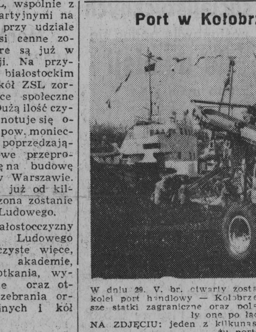
Port w Kołobrzegu — otwarty

czas uroczystości zostanie przekazany Powiatowemu Komitetowi ZSL sztandar Stronnictwa, ufundowany przez łomżyńską organizację ZSL. W trakcie uroczystości odbędą się ciekawe występy artystyczne, bogate po-