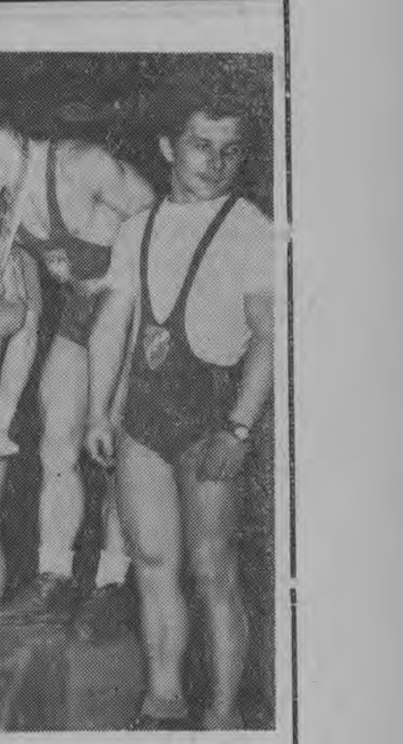
Z XIV indywidualnych mistrzostw Polski seniorów w podnoszeniu ciężarów, które w dniach 8—10 bm. rozegrane zostały w Białymstoku.

Również w ub. sobotę mieszkańcy powiatu monieckiego kontynuowali prace społeczne przy budowie dróg. (zm)