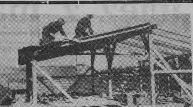
W tej szopie znajduje pomieszczenie nowoczesna prasa do produkcji cegły.

W cegielni nr 2 w Księżyńcu w rejonie Krasnowa praca. Poddano generalnemu remontowi piec do wypalu cegły.