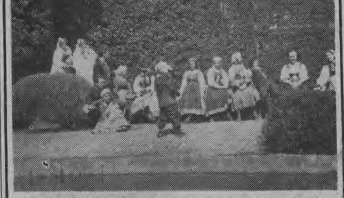
NA ZDJĘCIU: członkowie zespołu piosenki „Mazowsze” przed amfiteatrem w Tokio.