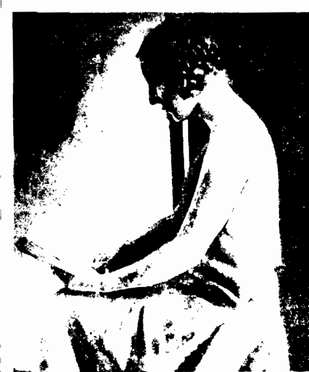
Z 30 MILJONOWYM WIANEM. Narzeczona rumuńskiego króla, księżniczka Siedmiogrodu, została za jedną z pięknych przedstawicielek arystokracji angielskiej, ale również za jedną z lepszych Paris. Obliczeniowi szacunki wzięte kwoty 30 milionów funtów szterlingów, przez co, z innych powodów, znowu kwoty, szacowane na kilkadziesiąt milionów funtów.