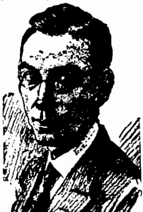
Wasilewski minister spraw zagranicznych, tragicznie zmarły, wskutek wypadku samochodowego.