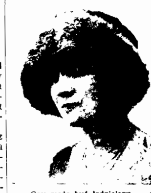
— Czy może być ładniejszy, — pyta uroczą paryżankę przymierzając nowy kapelusz i oglądając w lustrze jak bardzo jej jest w nim do twarzy.