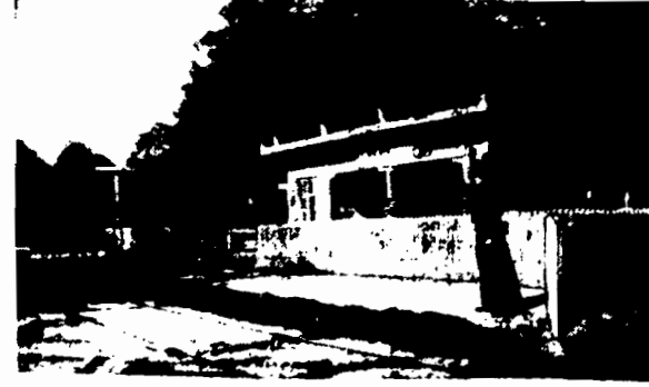
KOBIETA - KOLEJARZ PRZYJMUJE POCIĄG. Wielką sensację wywołało w Danii wiadomość, że zawiadowczyni stacji kolejowej ma w swej opecceciście w Julebach.