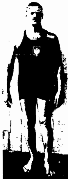
POLSKI MISTRZ W PŁYWIANIU

Kpt. Krowczyński (W. K. W.) bezkonkurencyjnie pływając w krótkim dystansie, ustanowił nowy rekord na 400 metrów w czasie 6 min. 55,5 sek.