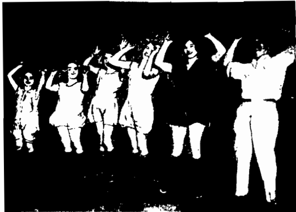
SMIECH TO — ZDROWIE

Bernard Mac Fedden znany amerykański lekarz ogłosił prace, w której dowodzi, że śmiech jest bardzo zdrowym dla ludzkiego organizmu. Fotografia nasza przedstawia ćwiczenia śmiechu rodziny Mac Fedden'a, wykonywane po spożyciu śniadania.