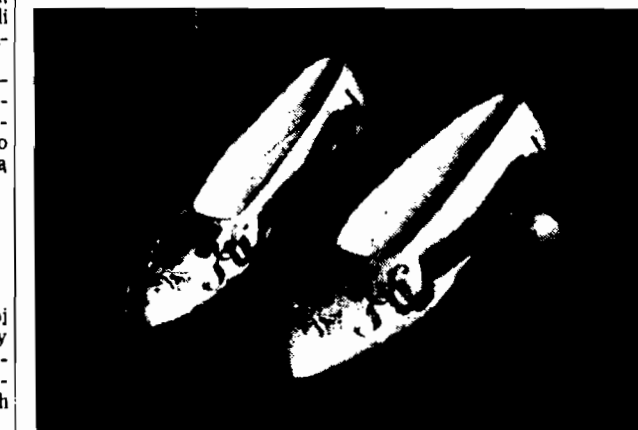
Jedwabne pantofelki haftowane złotem