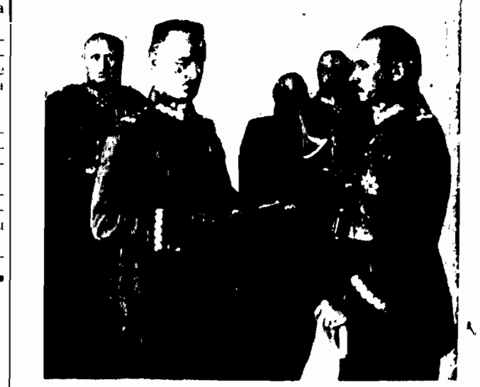
MINISTROWI WOJNY Gen. J. Haller wręczył gen. W. Sikorskiemu order „Cincinnati” otrzymany w Ameryce dla muzeum wojska polskiego.