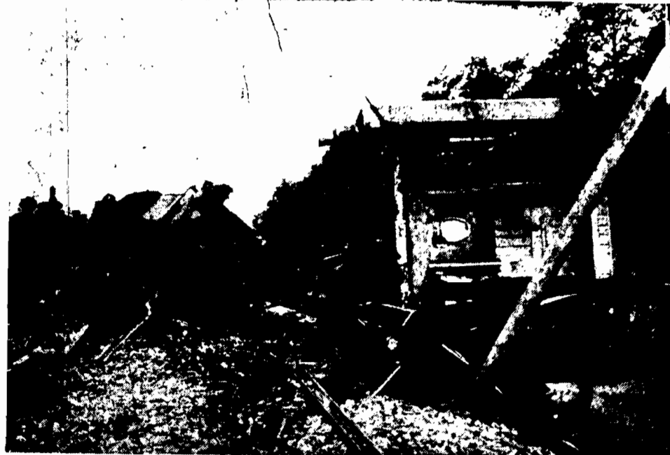
Zdjęcia specjalnego wysłannika z miejsca katastrofy