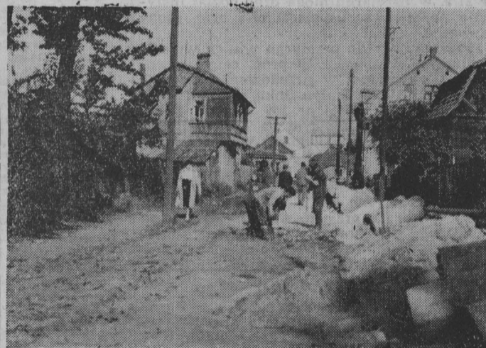
Wesolej wyniosła ponad 211 tys. zł, a wartość uzyskanych materiałów — 200 tys. zł.

Z dawnej ul. Wesolej pozostanie już chyba tylko nazwa. Ta, jedna z najbardziej zaniedbanych ulic w naszym mieście zmienia się obecnie nie do poznania. W czynie społecznym, dla uczczenia XX-lecia Polski Ludowej, członkowie Białostockiej Spółdzielni Mieszkaniowej postanowili ułożyć nową nawierzchnię i chodniki przy ul. Wesolej. Wartość kosztów robót drogowych zamknięcia się kwota 1.200.000 zł. Znaczna część tej sumy stanowią czynniki społeczne członków BSM, a szczególnie mieszkańców osiedla BSM przy ul. Garbarskiej. Dotychczasowa wartość pracy społecznej członków BSM przy budowie nowej nawierzchni na ul.