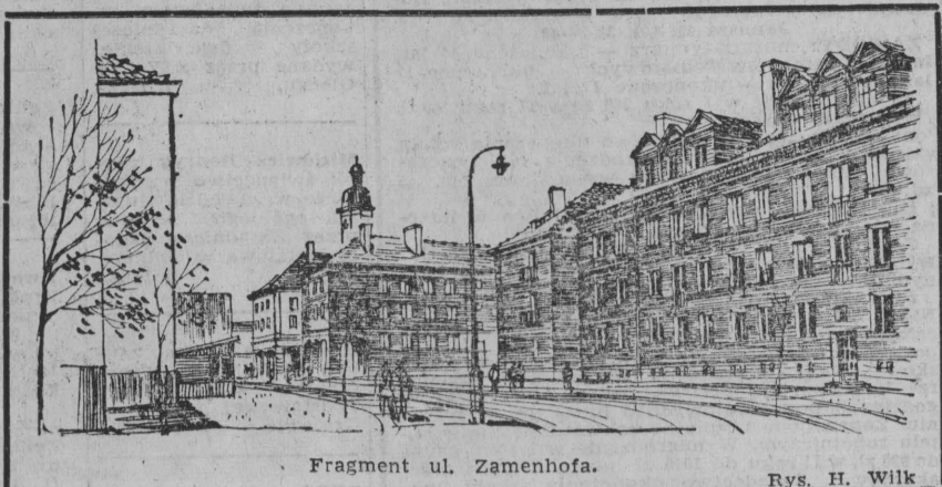
Fragment ul. Zamenhofs.

my dalej i chociaż nic nowego nie widzimy, ale za to czujemy. Po lewej stronie ulicy rwnstokiem płyną różne nieczyścioty i stad te „zapachy”. Starając się nie oddychać nosem — idziemy dalej. Czytamy napis „Ulica Lipowa”. No tak! Ale gdzie są te lipy? Potem dowiadujemy się, że drzewka były, ale padły ofiarą oczyszczania chodników ze śniegu przy pomocy soli. Tak więc pierwsze wrażenia z grodu nad Białą — nieszczerzy. A warto zadbac o to, aby przybysze, tuż po wyjściu z dworca, nie musieli oglądać takich widoków, jak my w tym spacerze „na niby”. (zet)