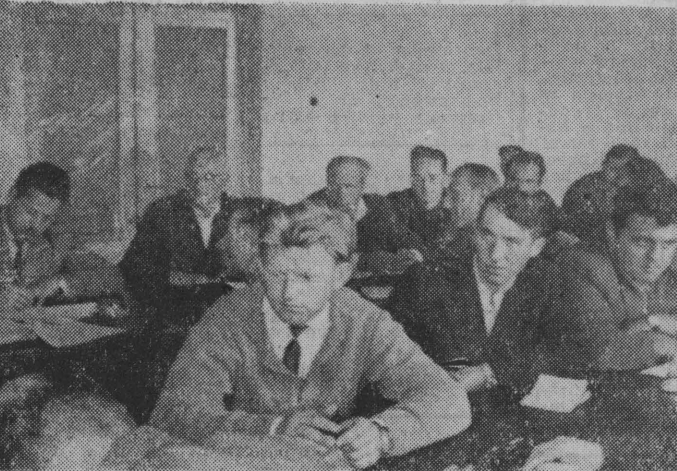
NA ZDJĘCIU: na sali obrad,

Z okazji miesiąca obudowy Warszawy, odbył się niedawno w Bielsku Podlaskim zjazd delegatów miejskich i gromadzkich